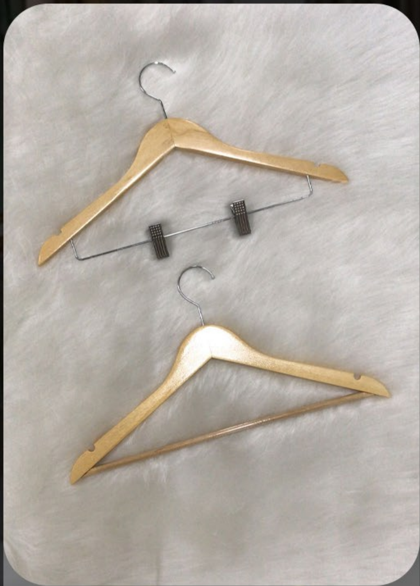
Cabides de madeira