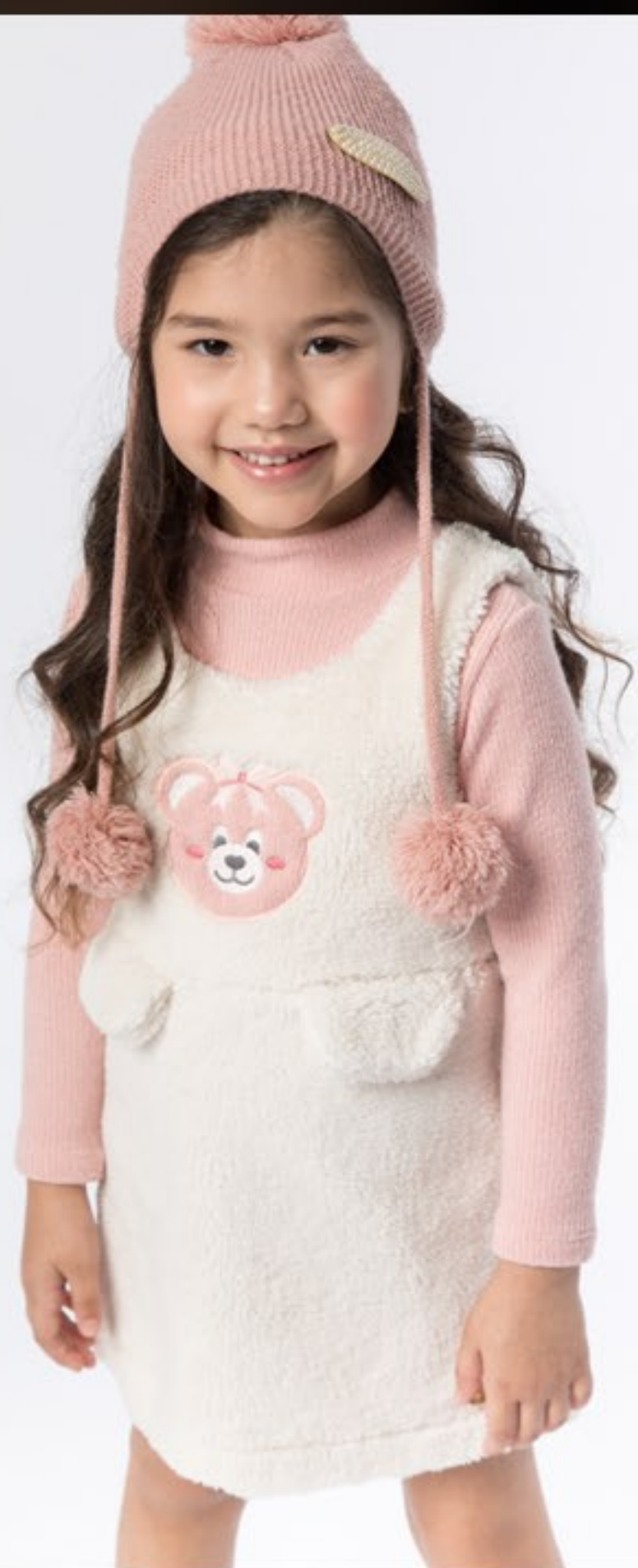
Cj salopete pelúcia com blusa cacharrel. Tam 1 ao 4