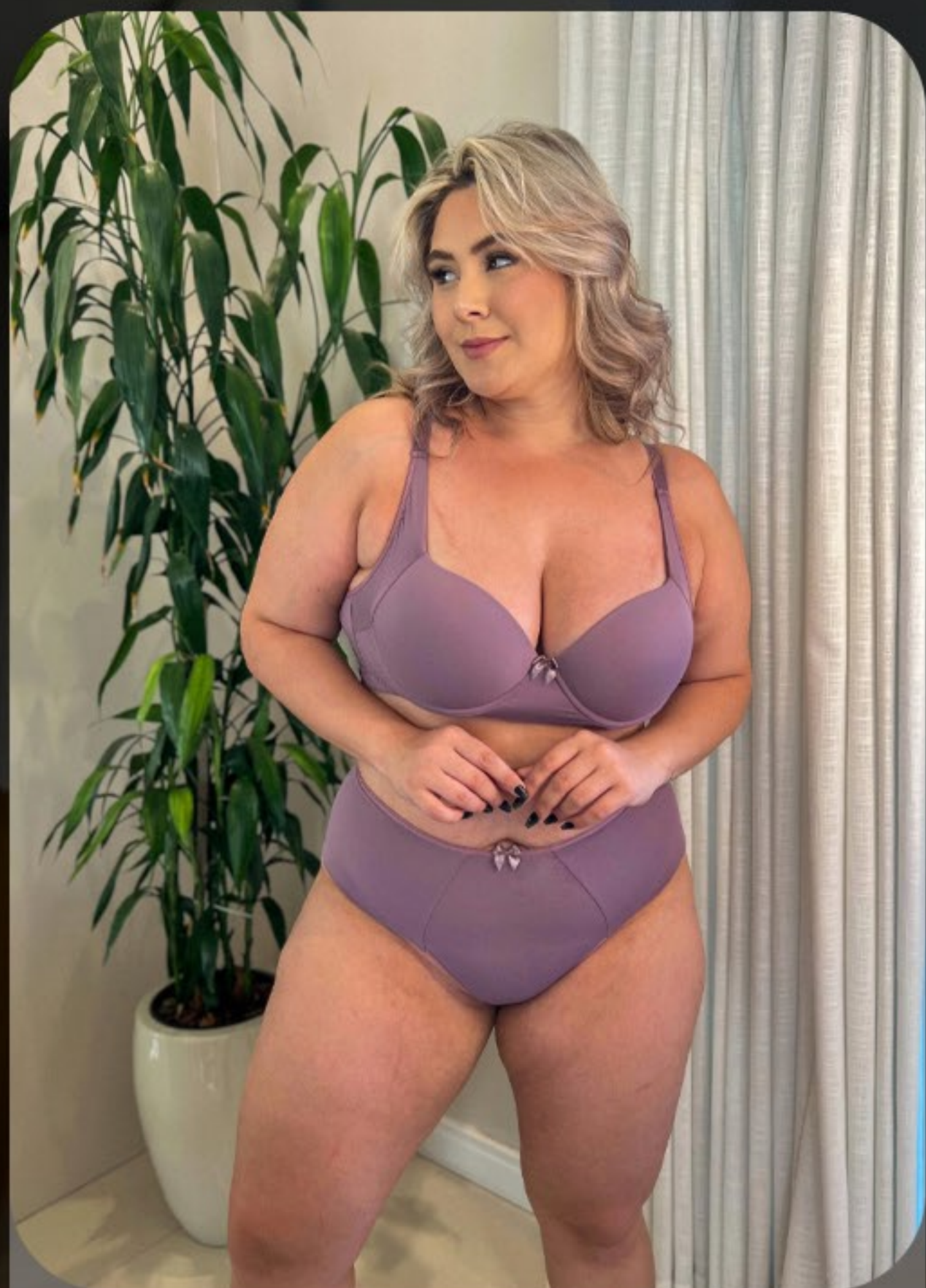
Conjunto plus size