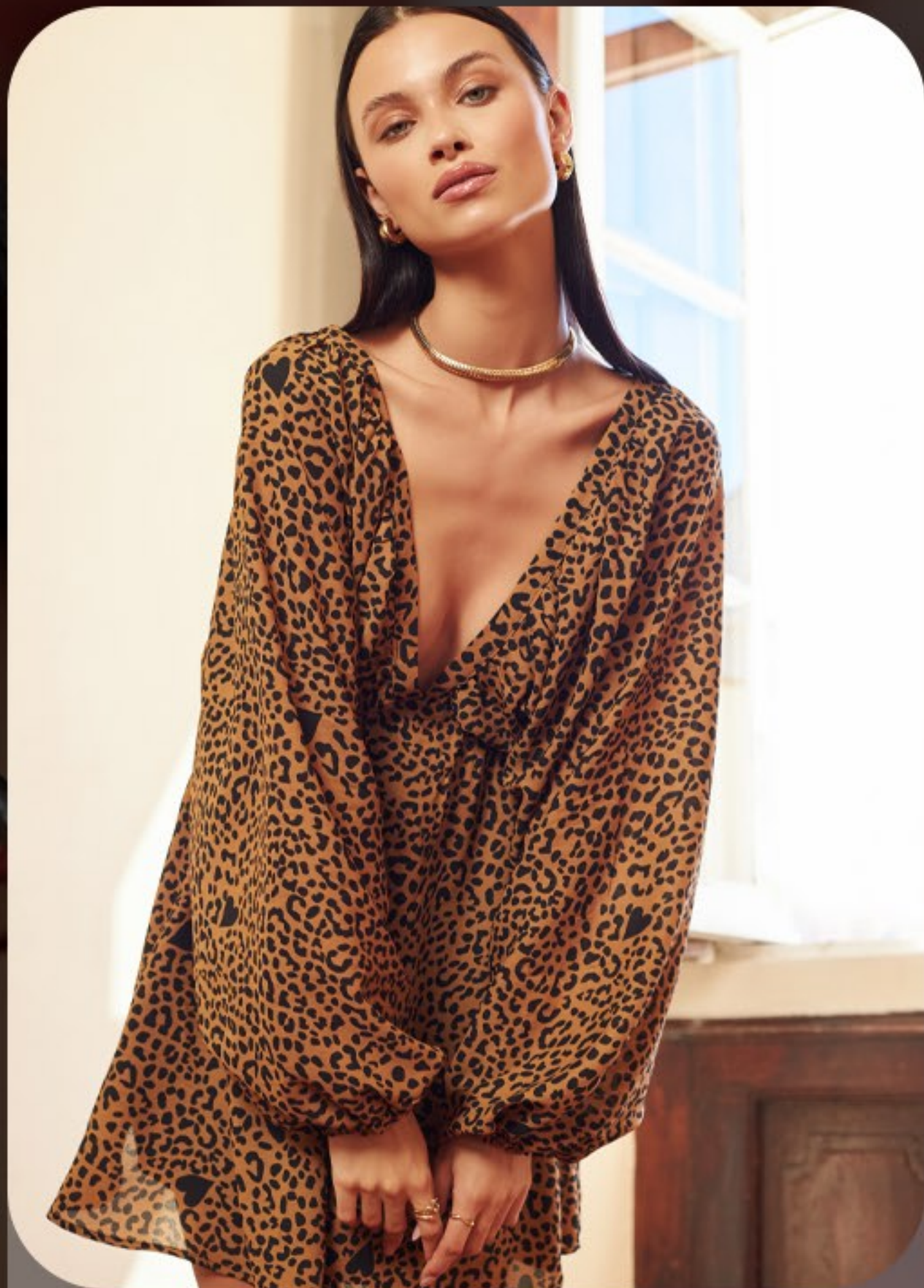
Vestido curto animal print