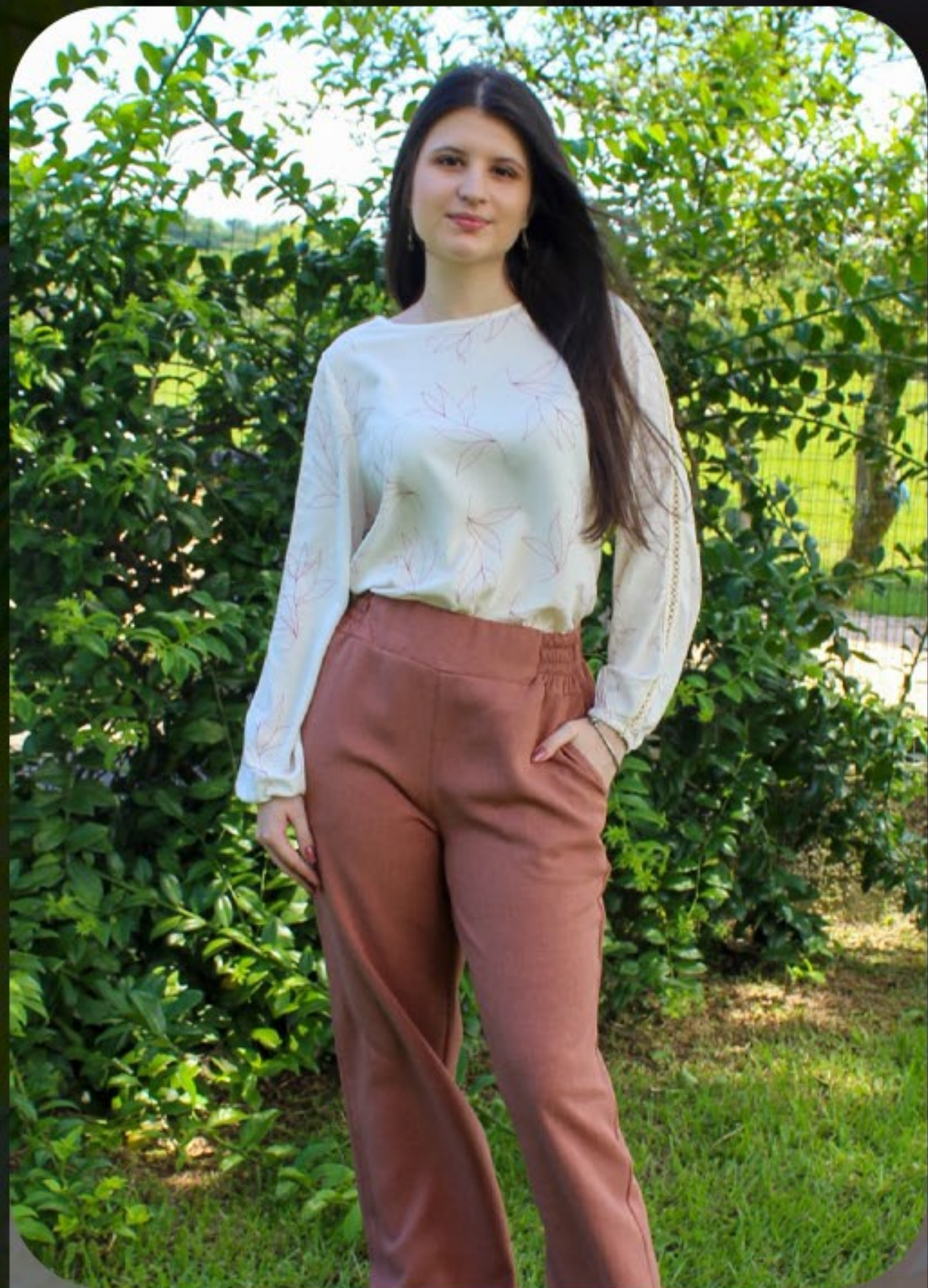
Blusa viscolinho detalhe manga, calça linho doha perna reta