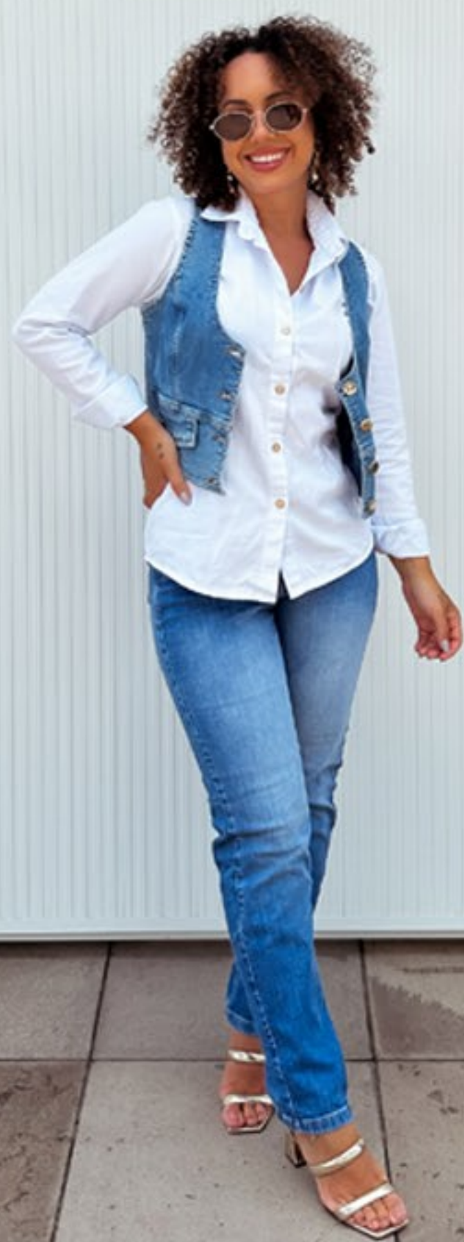
Colete Jeans , calça Mom