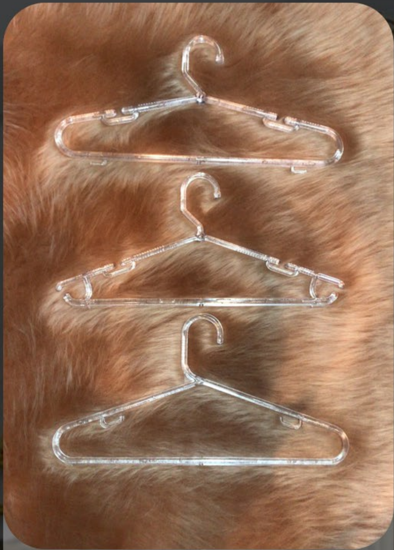
Cabides em Acrílico