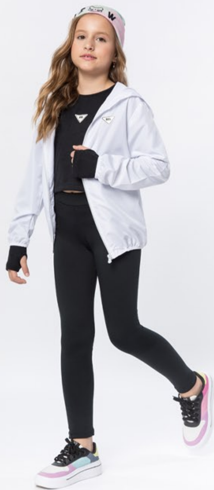
Jaqueta corta vento. Tam 1 ao 18