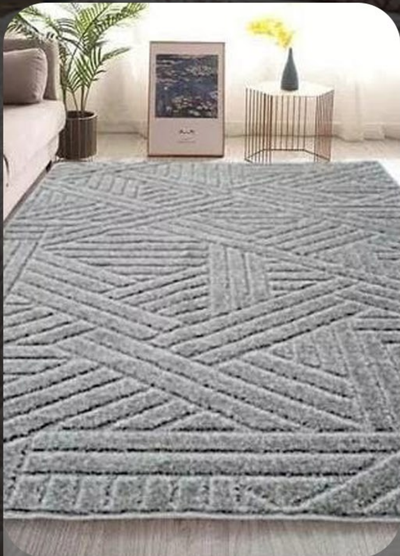
Tapete realce trama