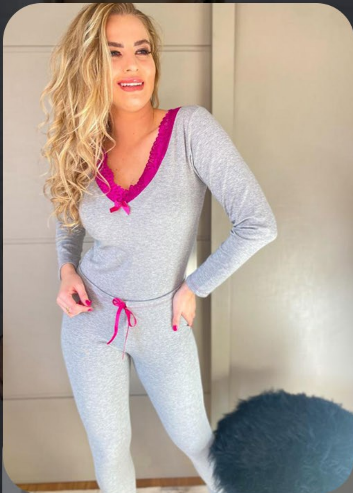
Pijama longo, modelagem mais ajustada ao corpo com gola de renda, tecido em Ribana