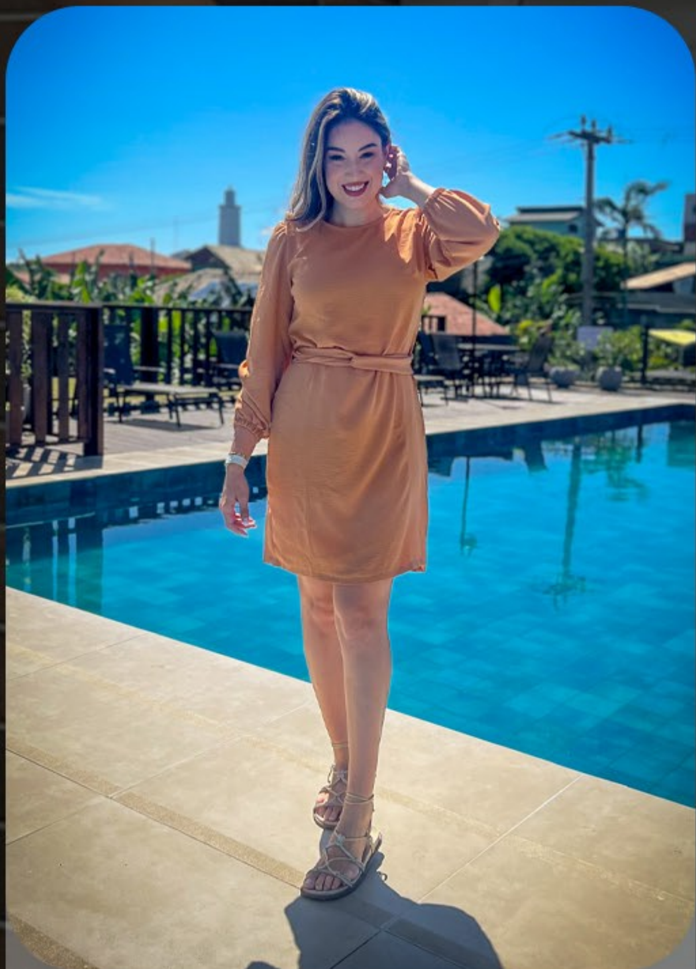
Vestido soltinho com cinto Preto e caramelo, do P ao XGG