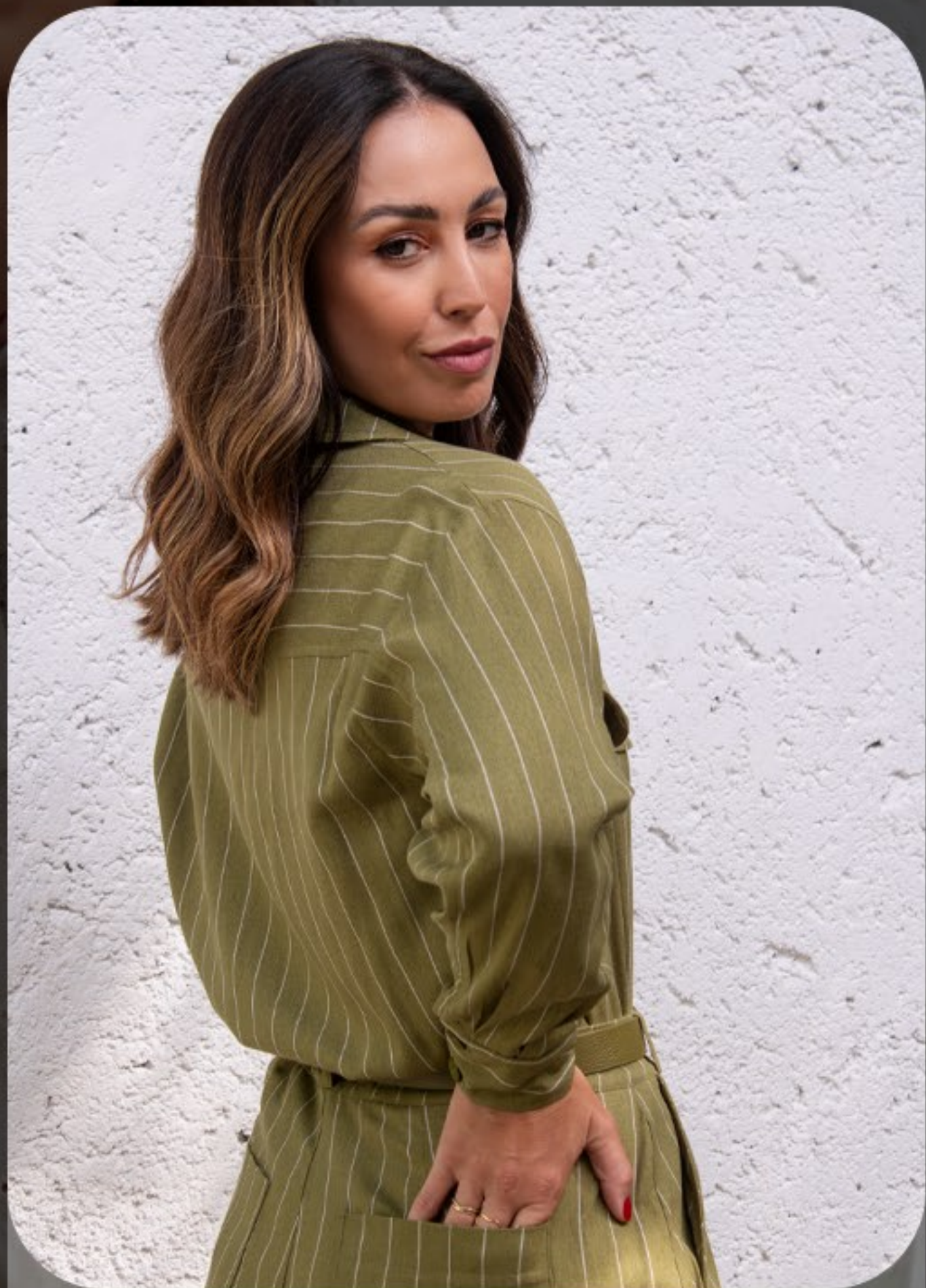
Conjunto verde militar feito em linho listrado + calça reta com bolsos traseiros