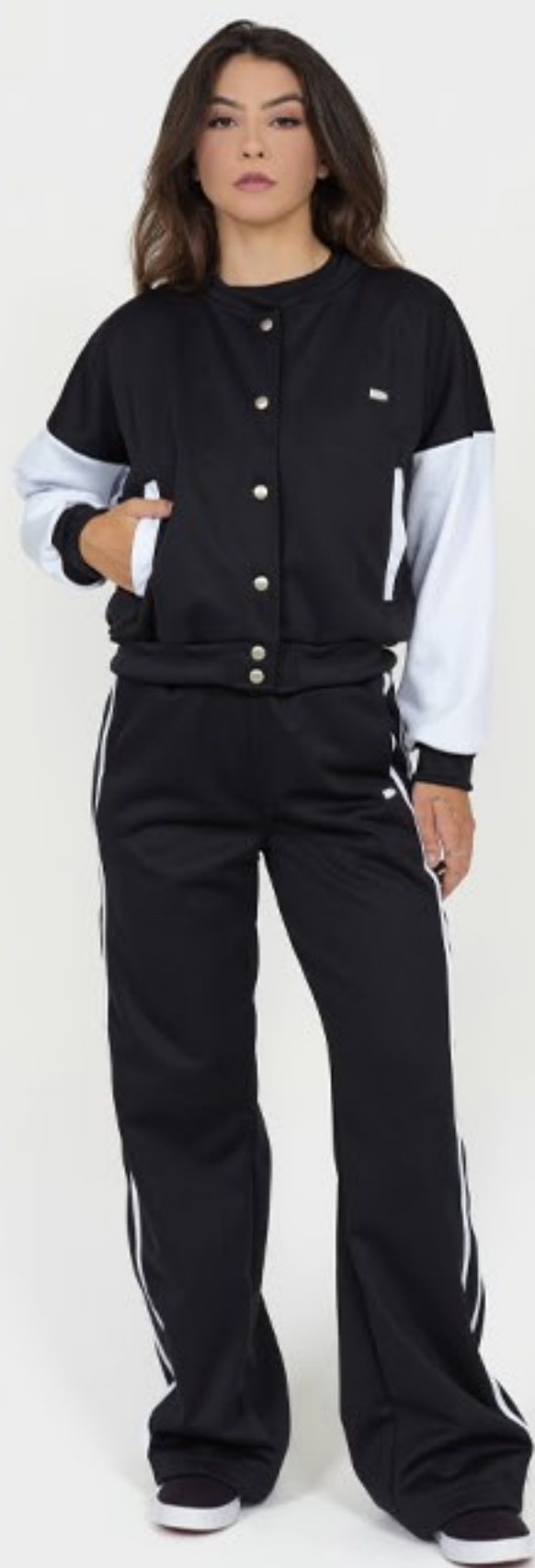
Jaqueta modelo bomber e calça wideleg, com modelagem larga e listras nas laterais