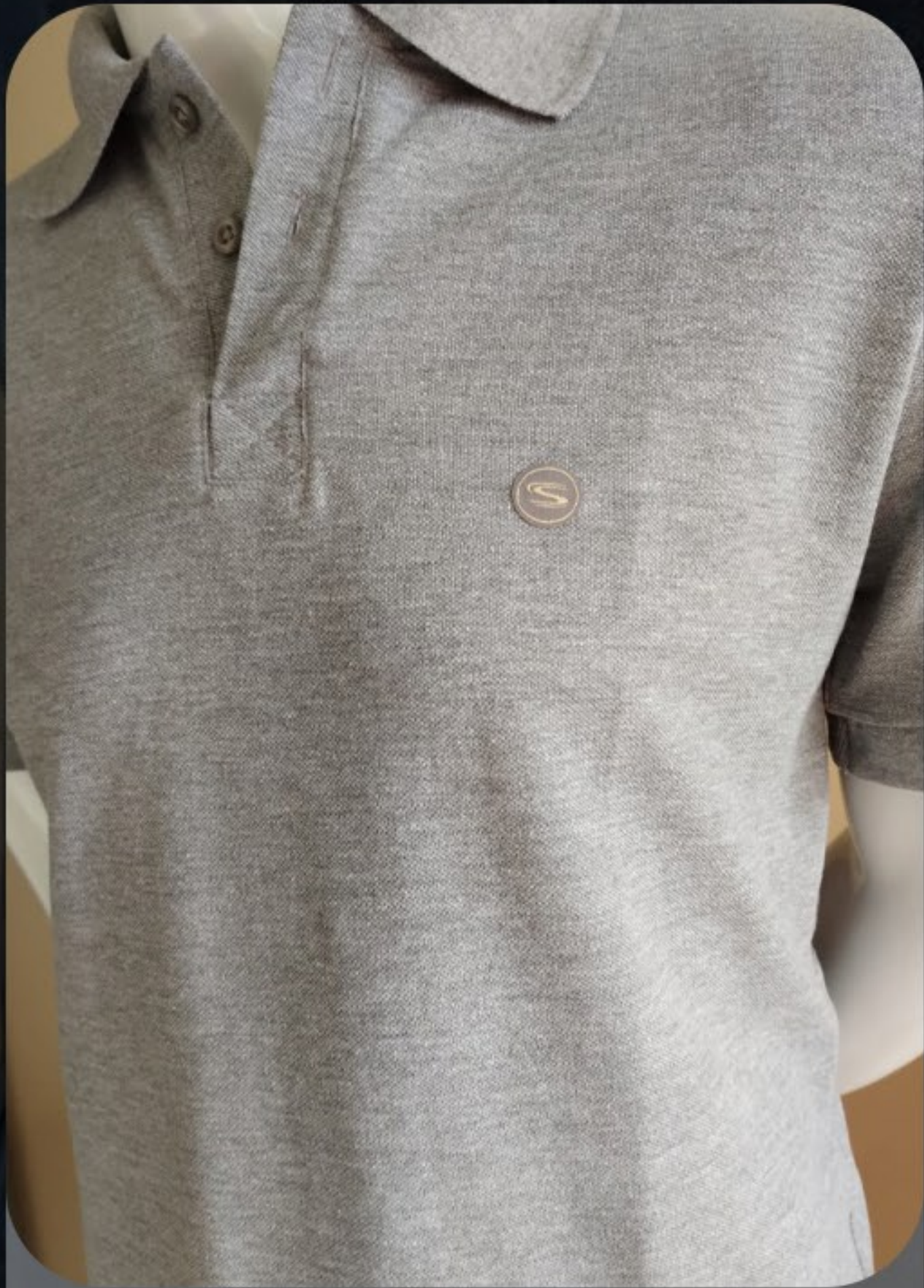
Polo piquet cores leves caimento confortável de algodão e poliéster