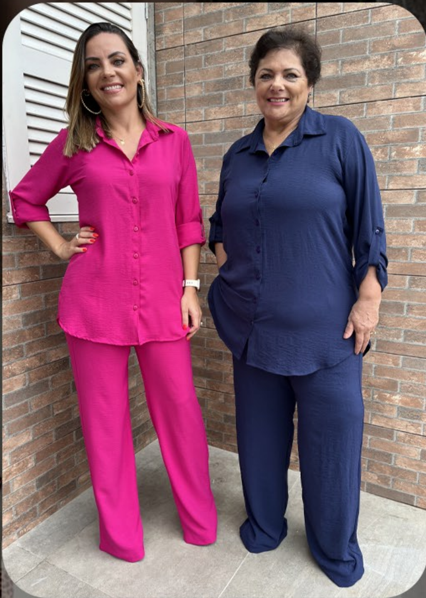
Camisa alongada e calça pantalone crepe