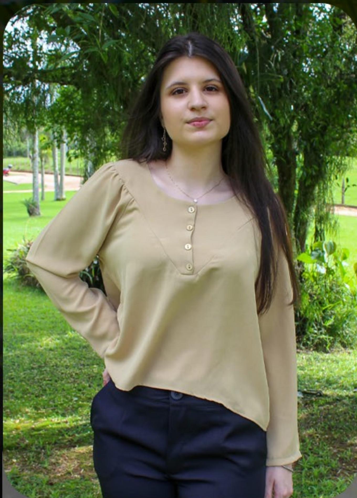
Blusa Ivy Twill recorte botões