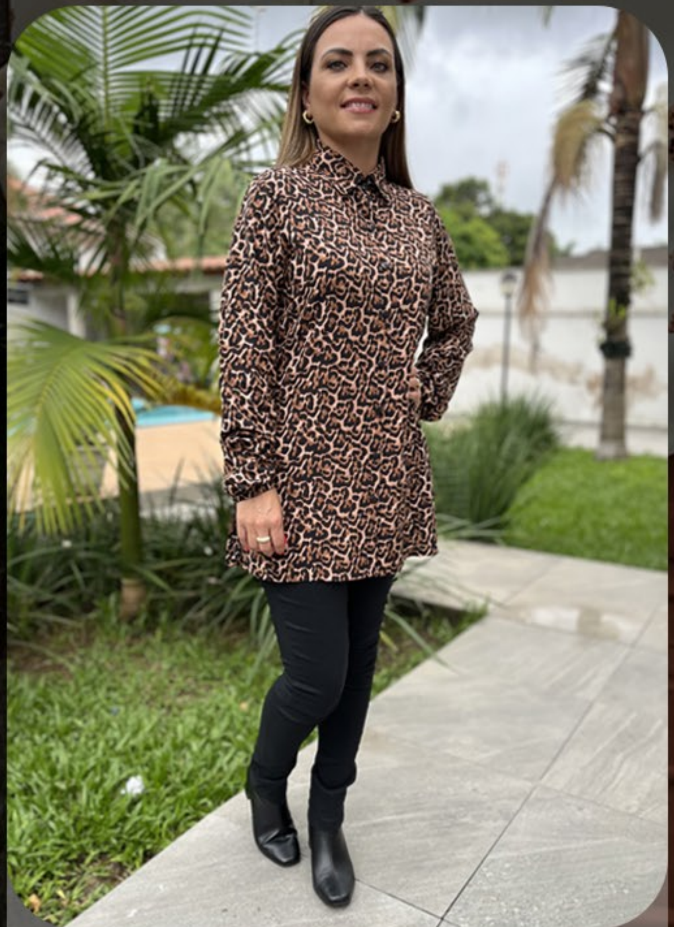
Camisa alongada viscose e calça bengaline