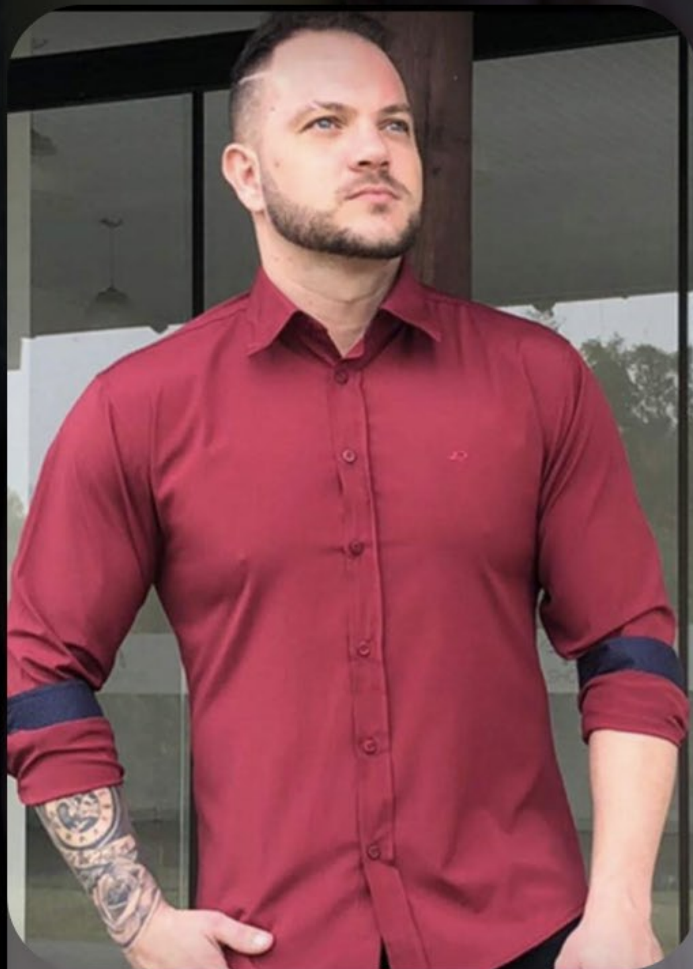
Camisa slim com elastano