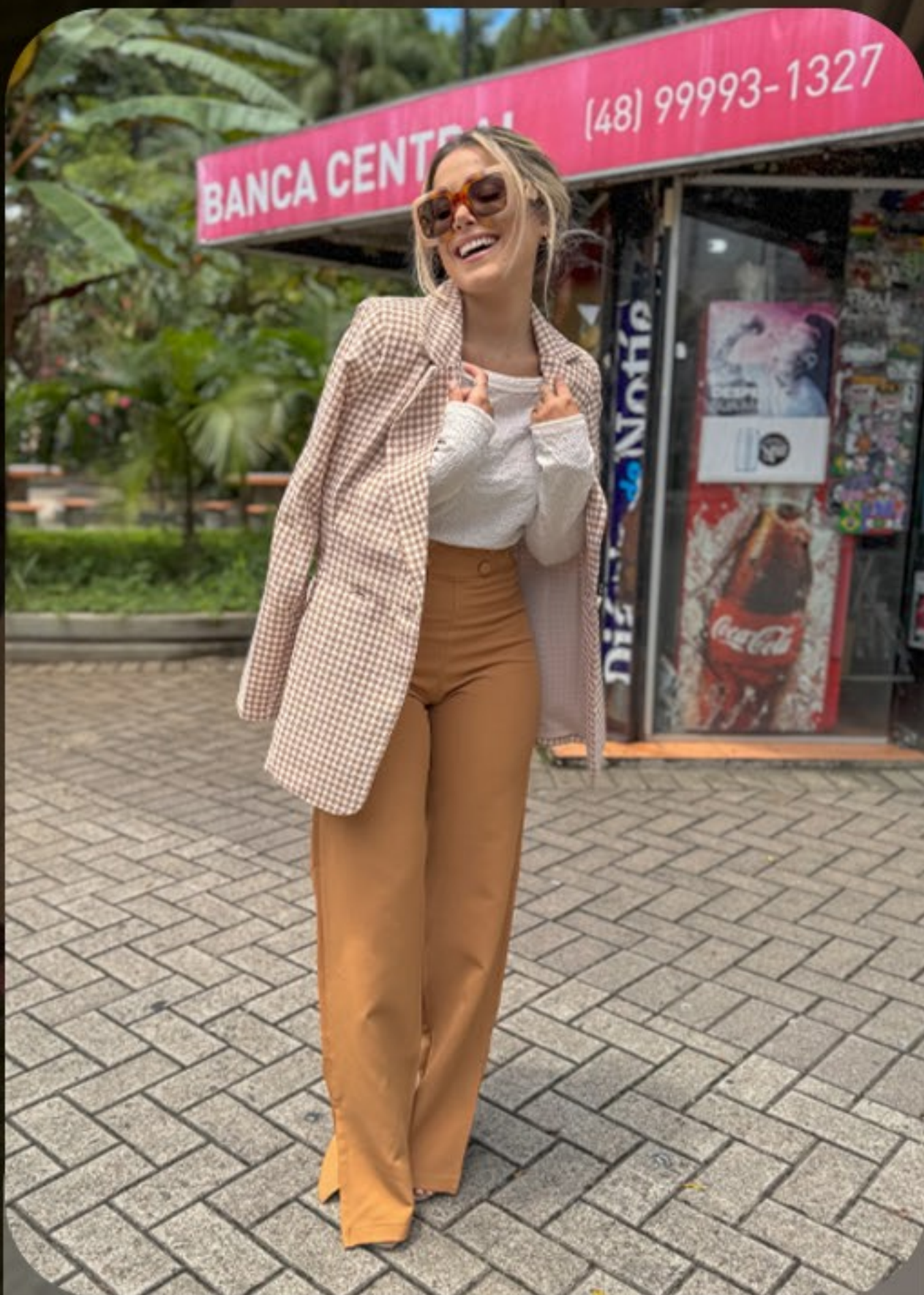
Blazer em tweed com estampa Pied de Poule Calça pantalonada em alfaiataria e cós alto