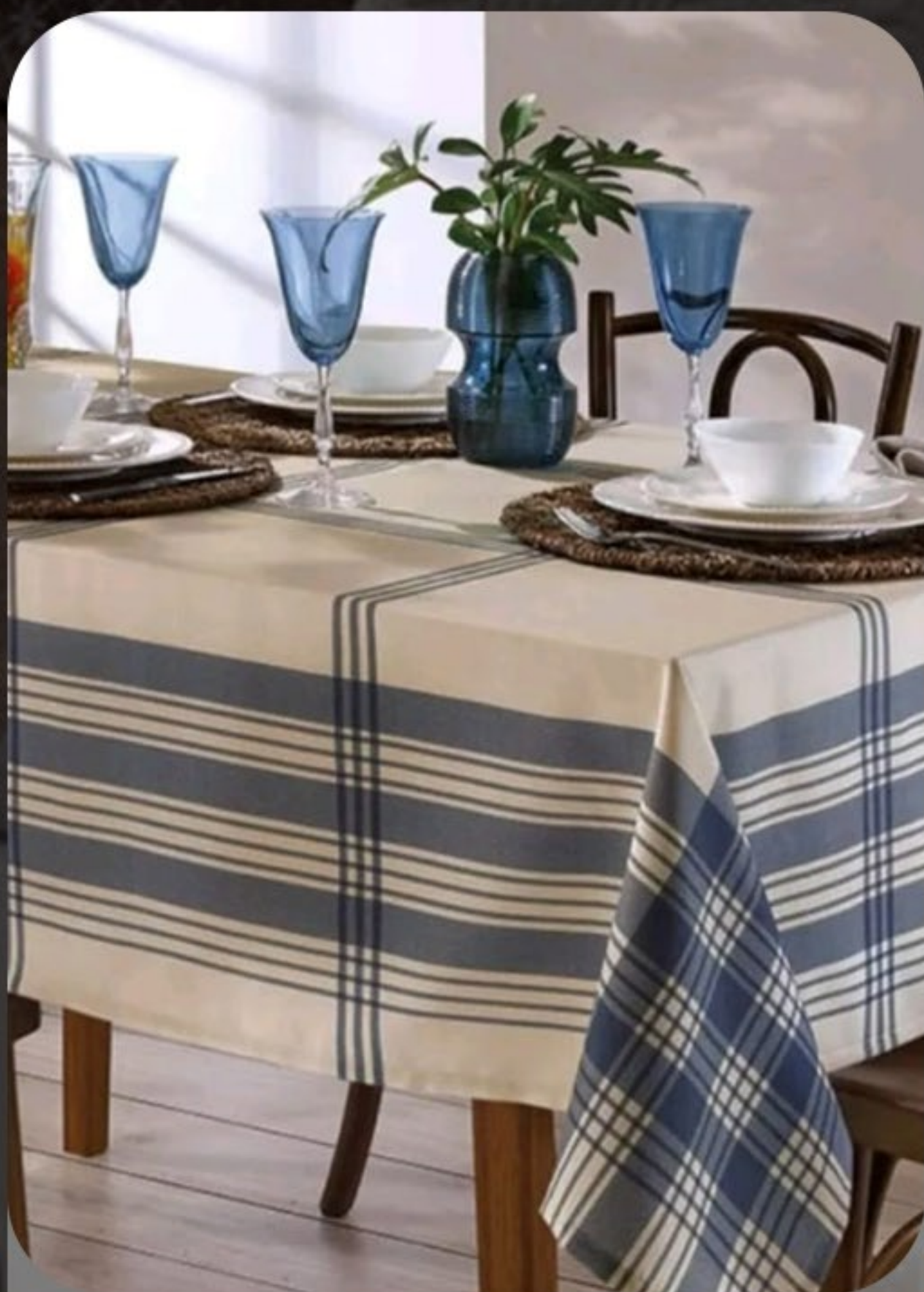
Toalha de mesa Dóhler Renova