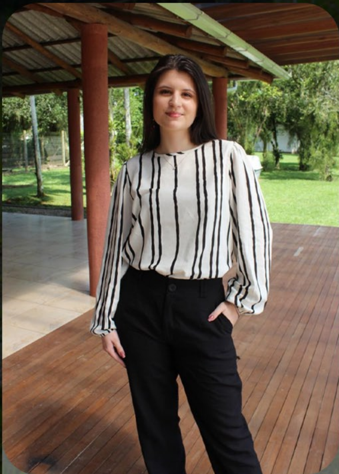
Blusa viscolinho manga fofa