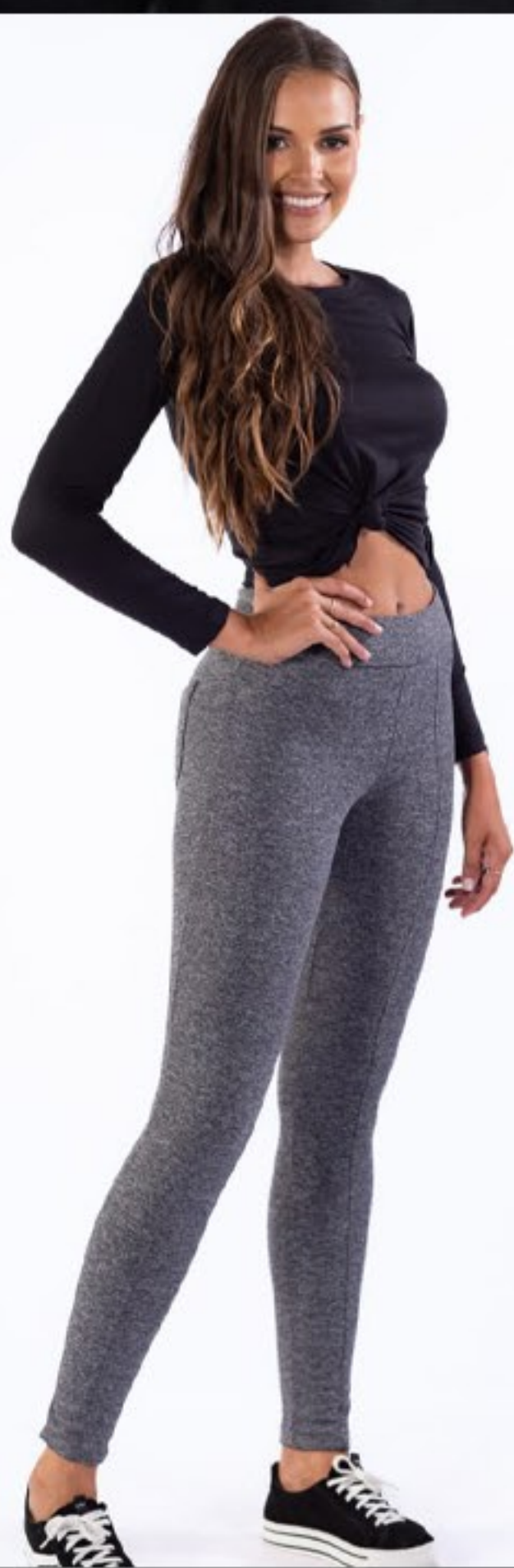
montaria térmica fem e blusa suedi térmica