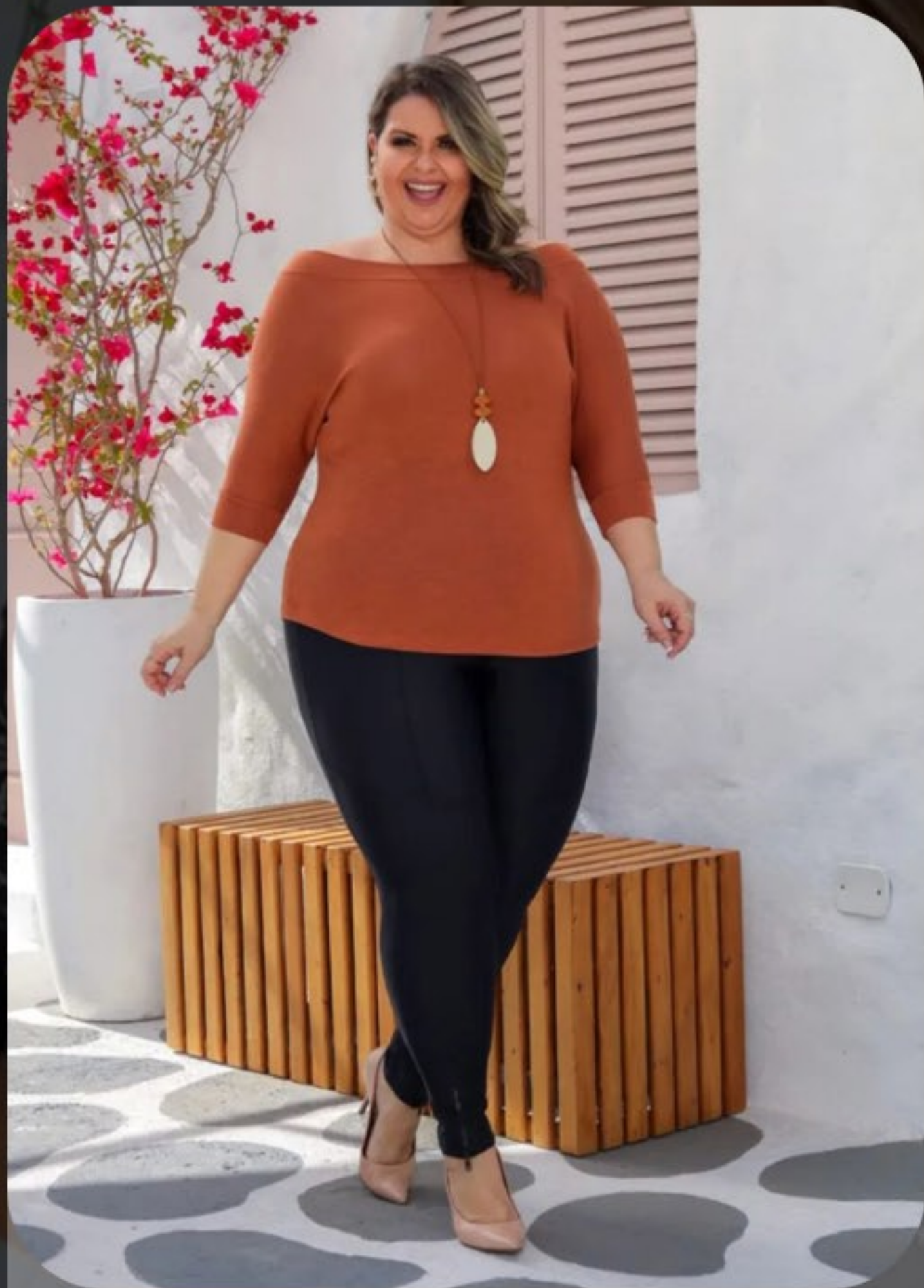
Blusa decote canoa. Tamanho único plus