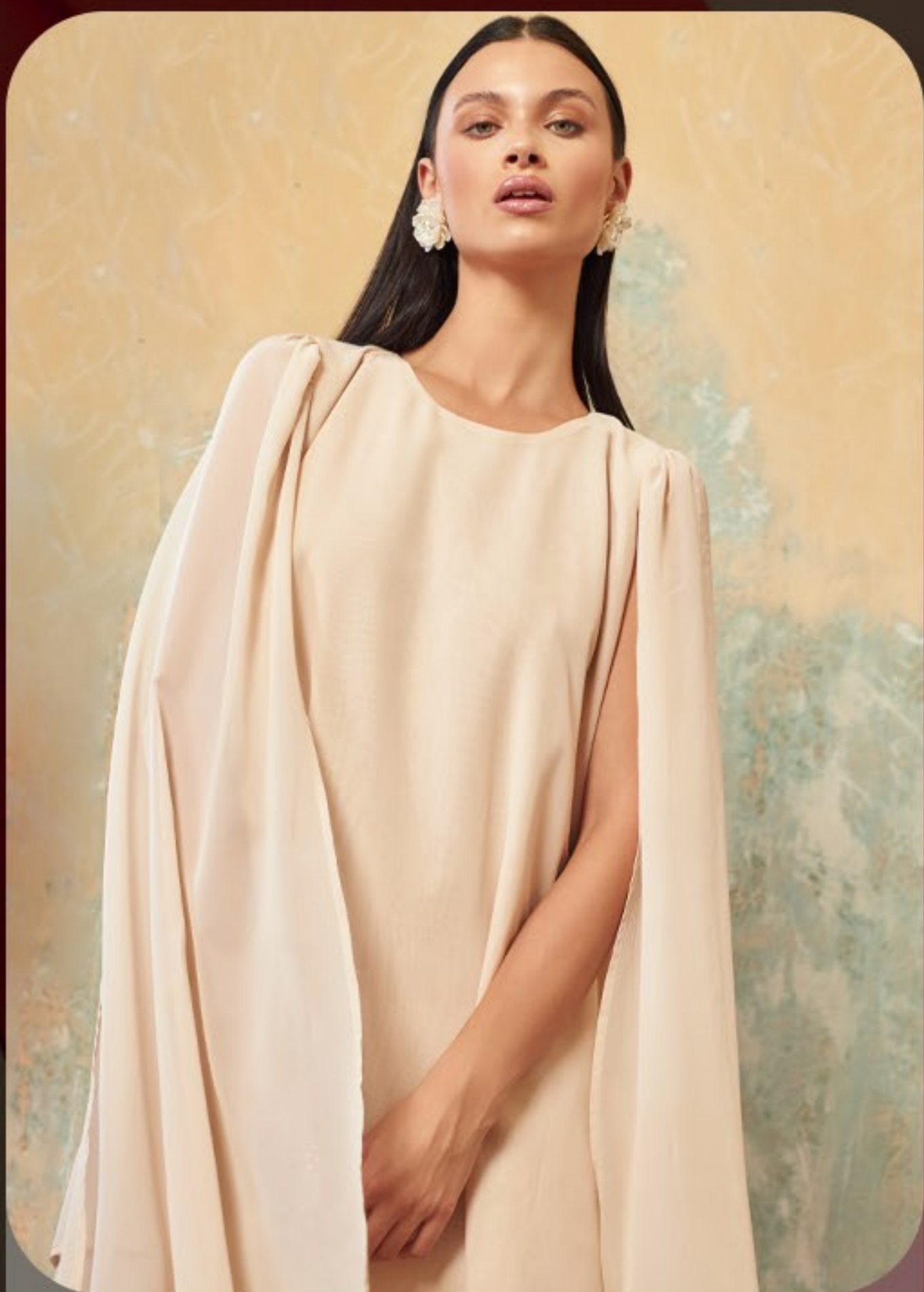
Vestido curto com capa