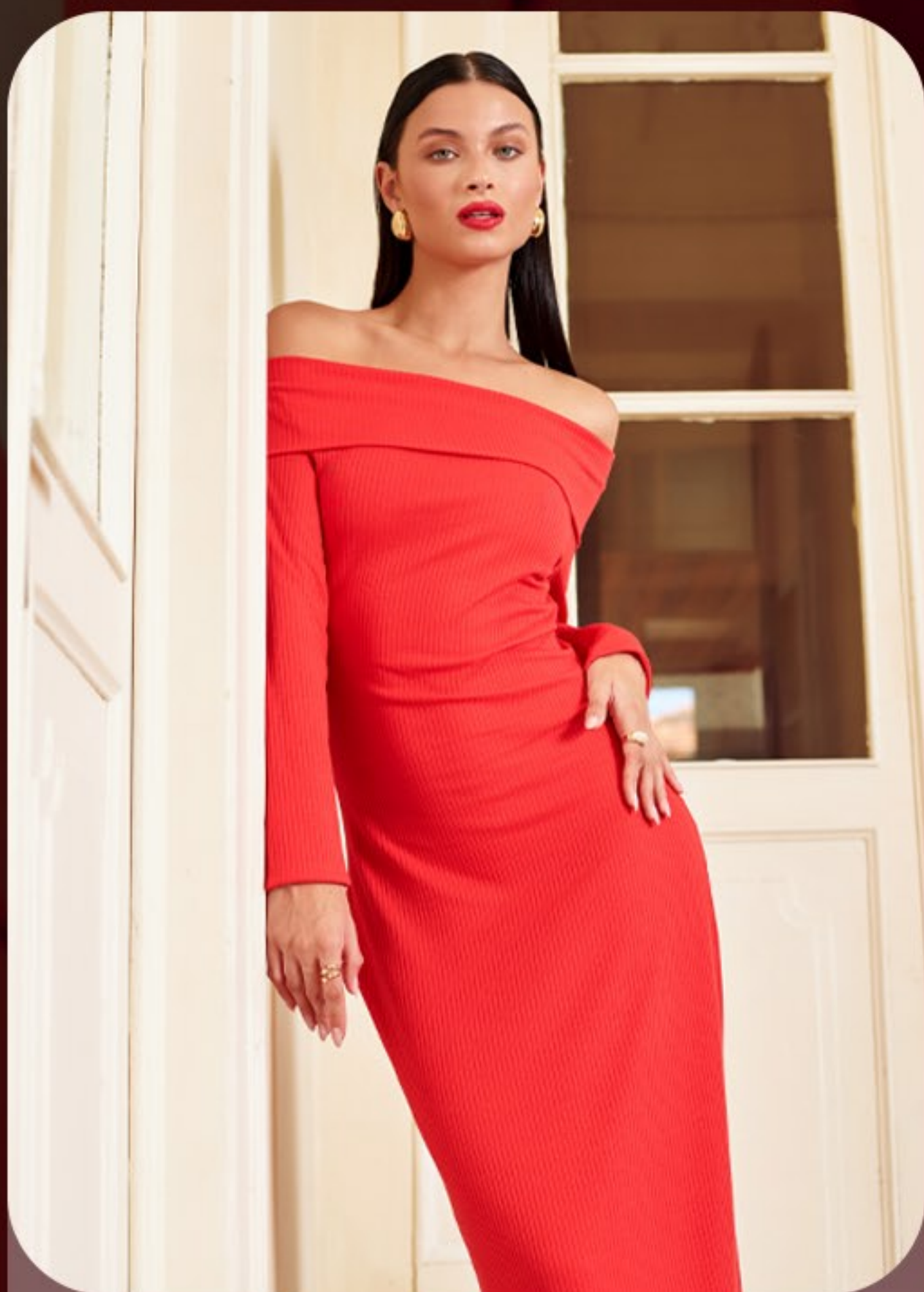
Vestido super midi, malha canelada