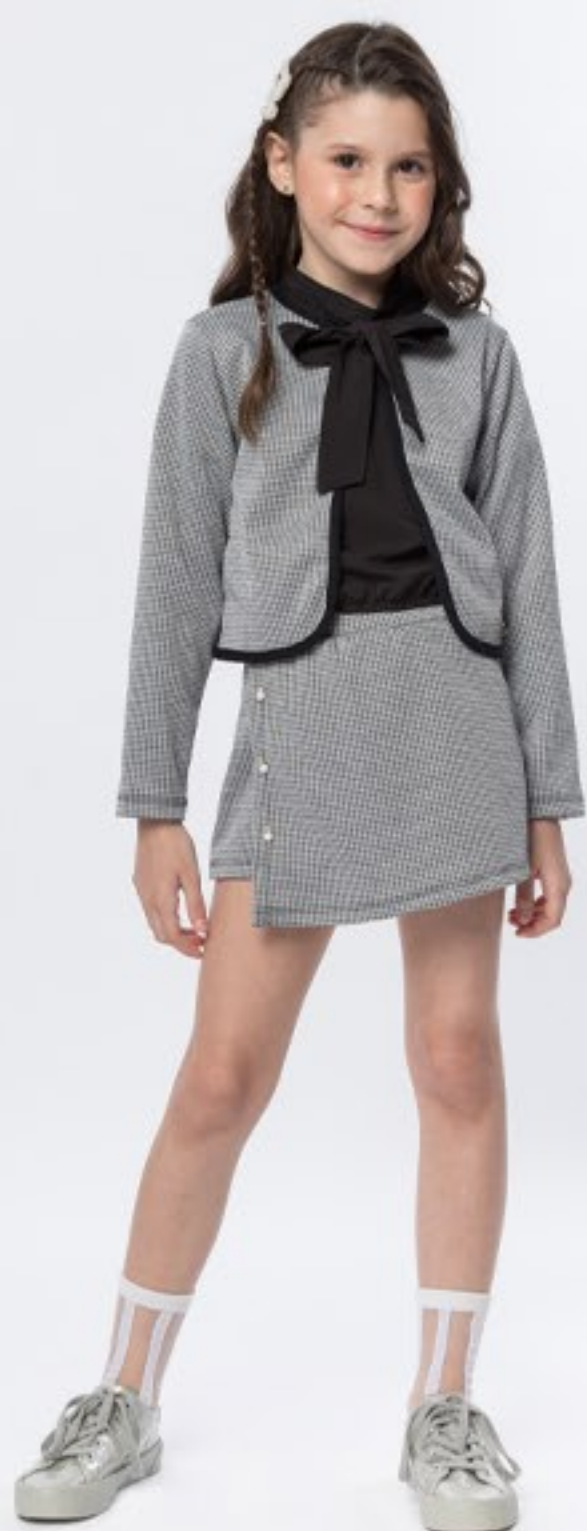
Trijunto casaqueto e saia jaquard, blusa tecido. Tam 4 ao 14