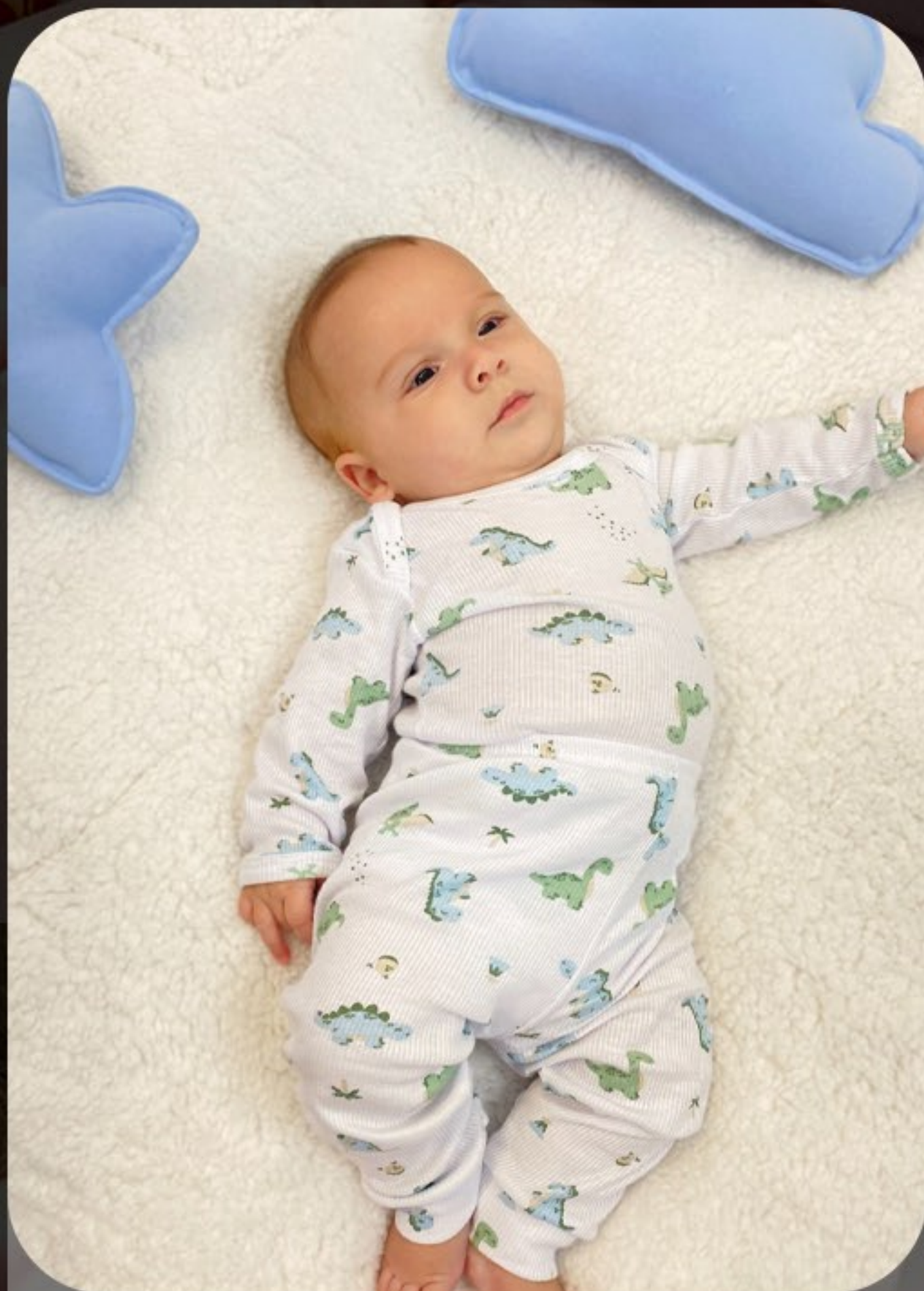
Conj body canelado 100% algodão. Tam RN ao 03