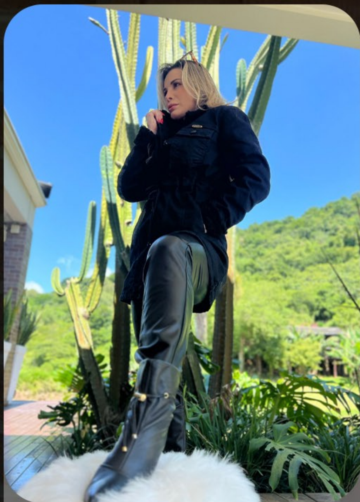
Parka forrada de sherpa preta Kizari calça slim de couro PU