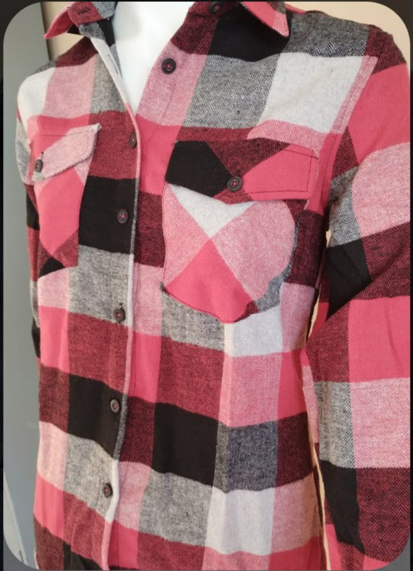
Camisa flanela feminina algodão, poliéster em várias estampas