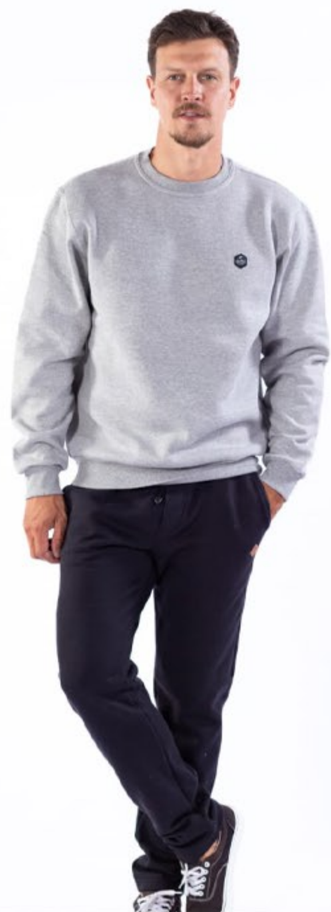
blusão careca masculino