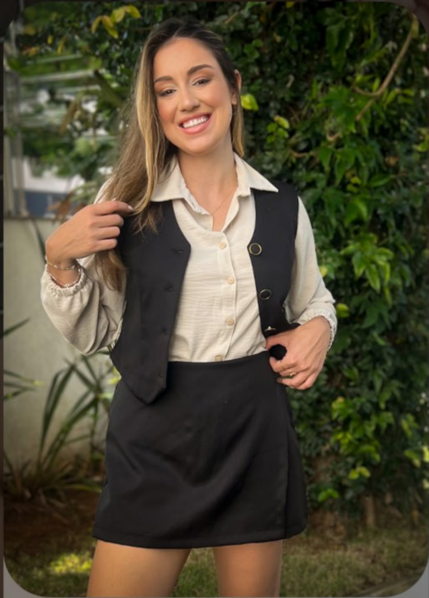
Colete curto preto e bege, camisa preta e off shorts saia preto e bege, Do P ao GG