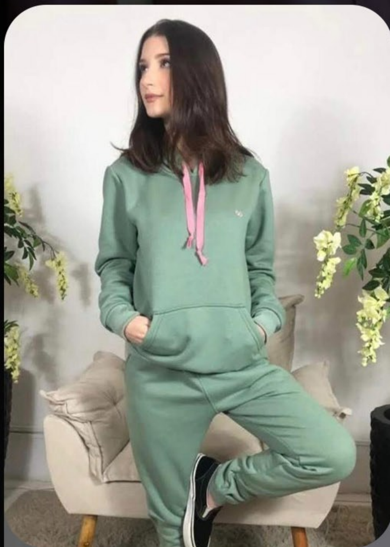
Conjunto moletom 3 cabos com pelucia