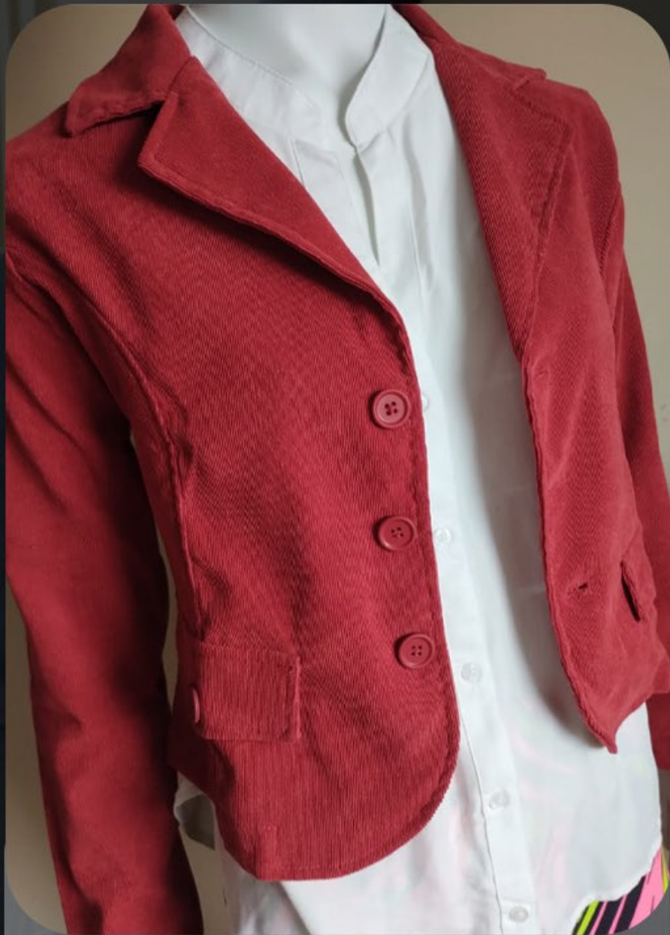
Jaqueta feminina veludo cropped. Disponível do P ao GG