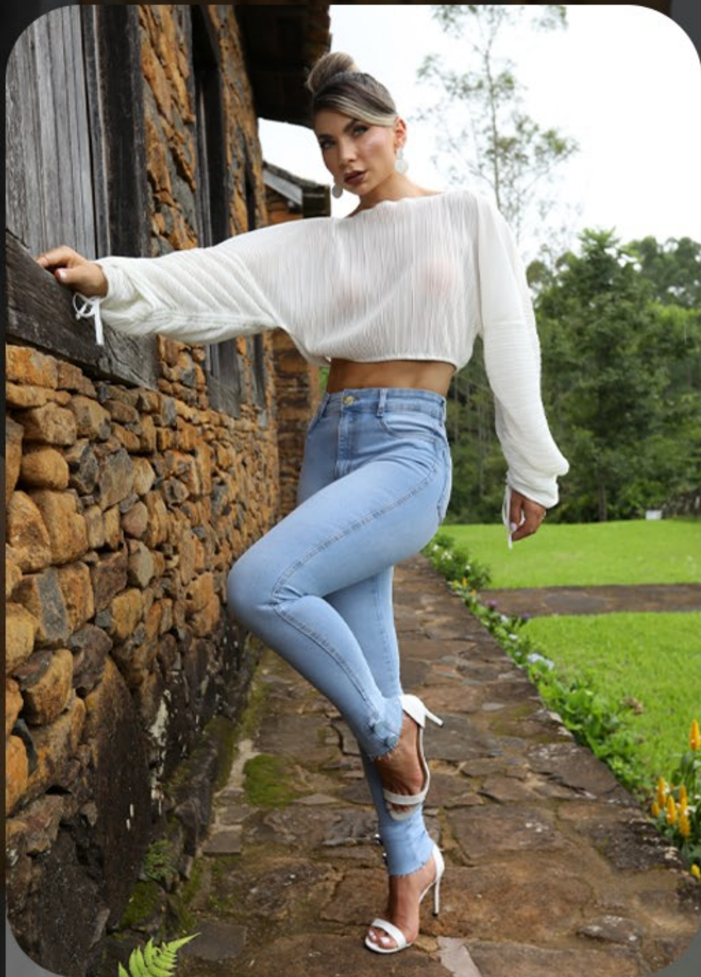
CF Cigarrete com detalhe botão na barra