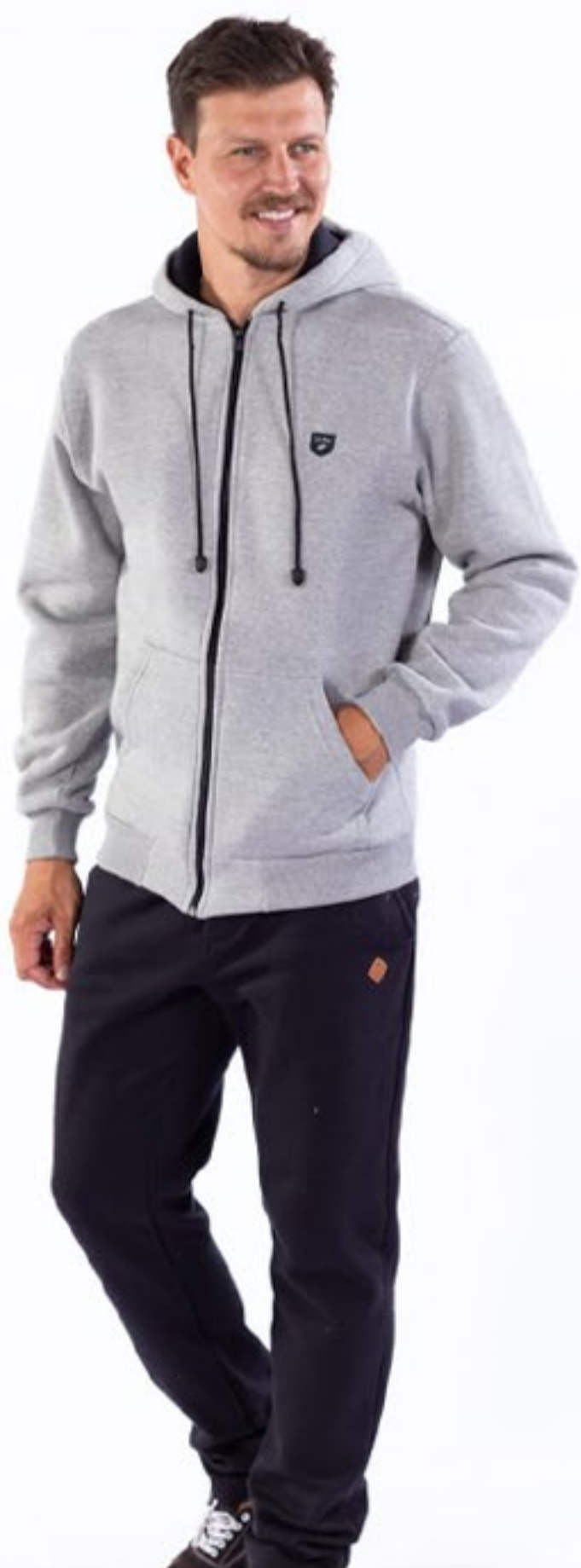
jaqueta moleton mase