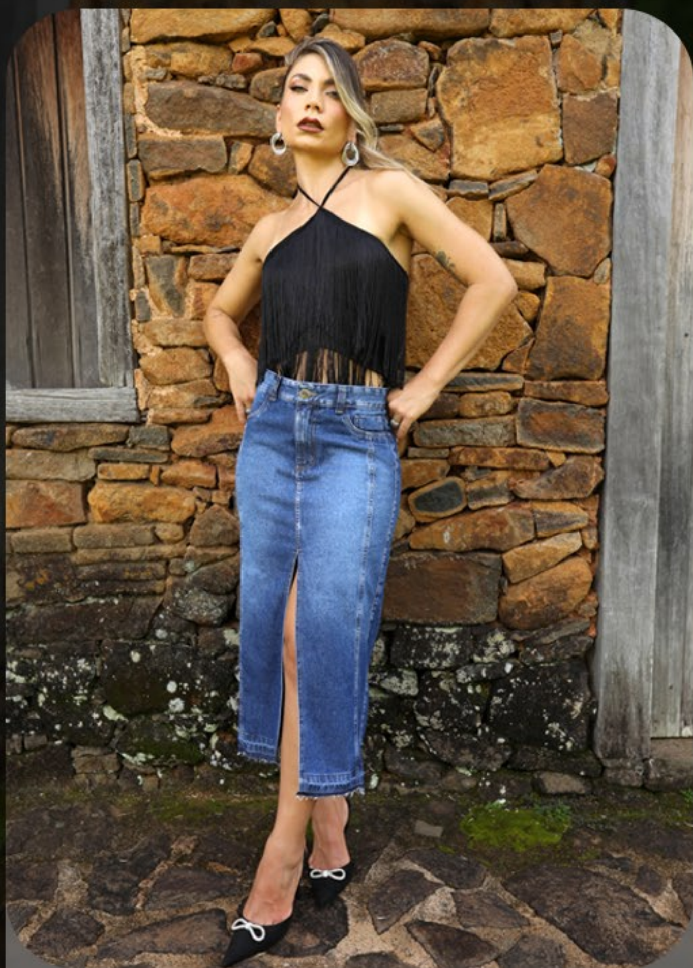
Saia midi com detalhe abertura na frente