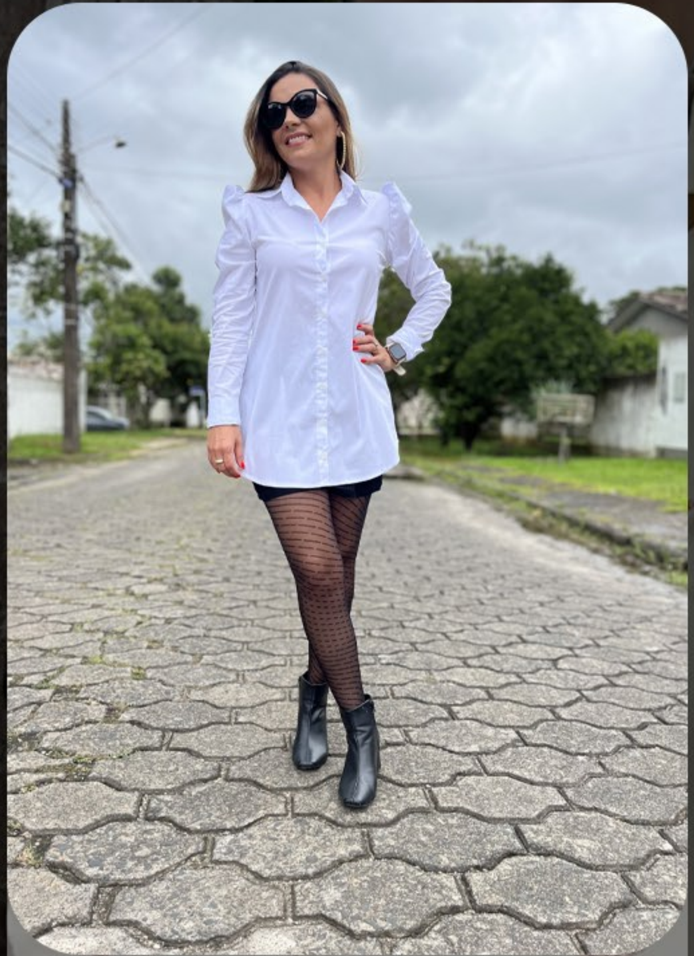
Camisa alongada princesa e saia canelada