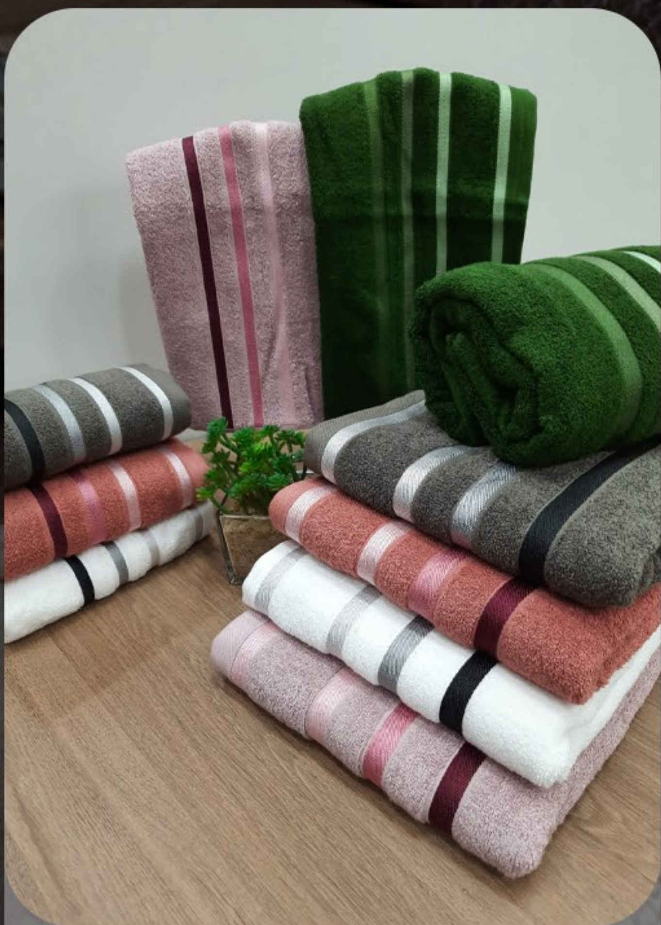
Toalha banheiro teka 100% algodão