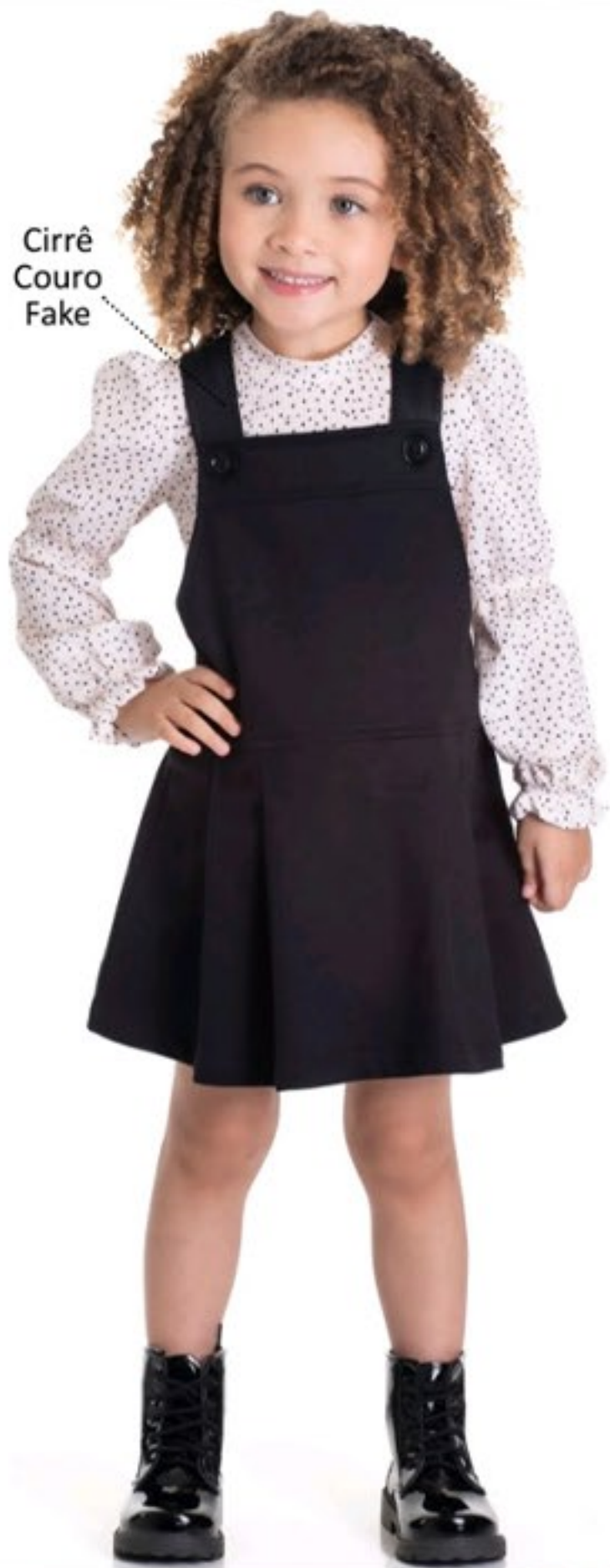
Look menina conj blusa relive salopete moletom s felpa. Tam 01 ao 12