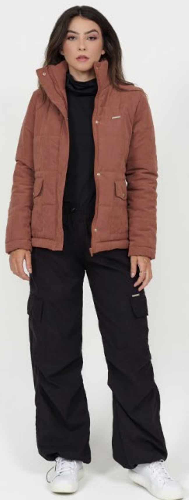
Jaqueta modelo cargo, gola alta e calça para quedas, com modelagem larga