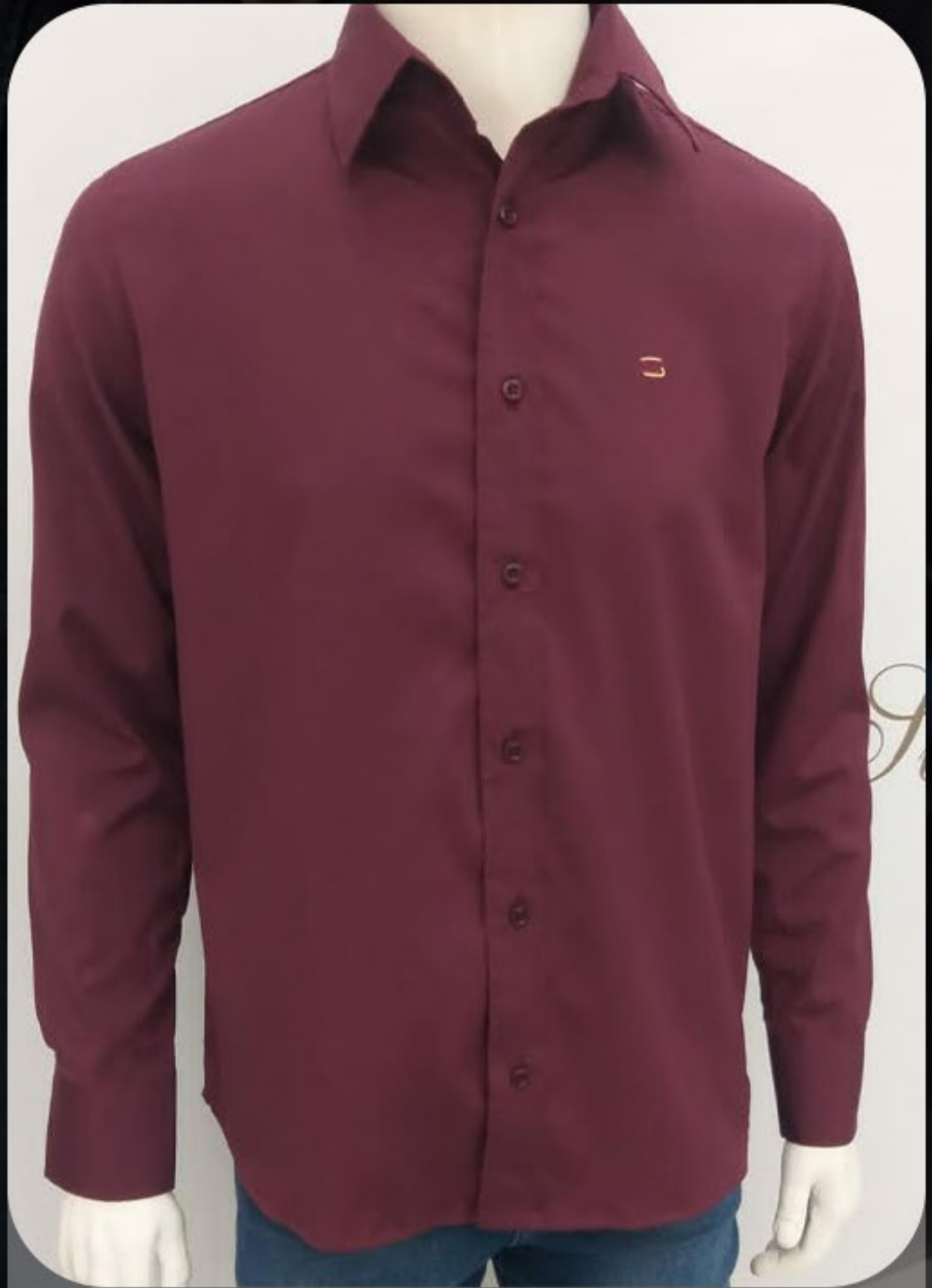
camisa slim em elastano e algodão