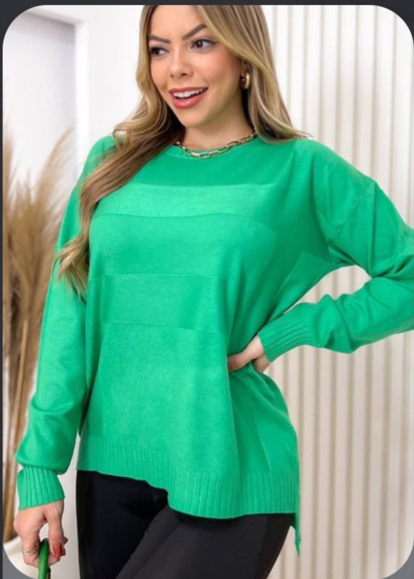
Blusa modal listra. Tamanho M a GG