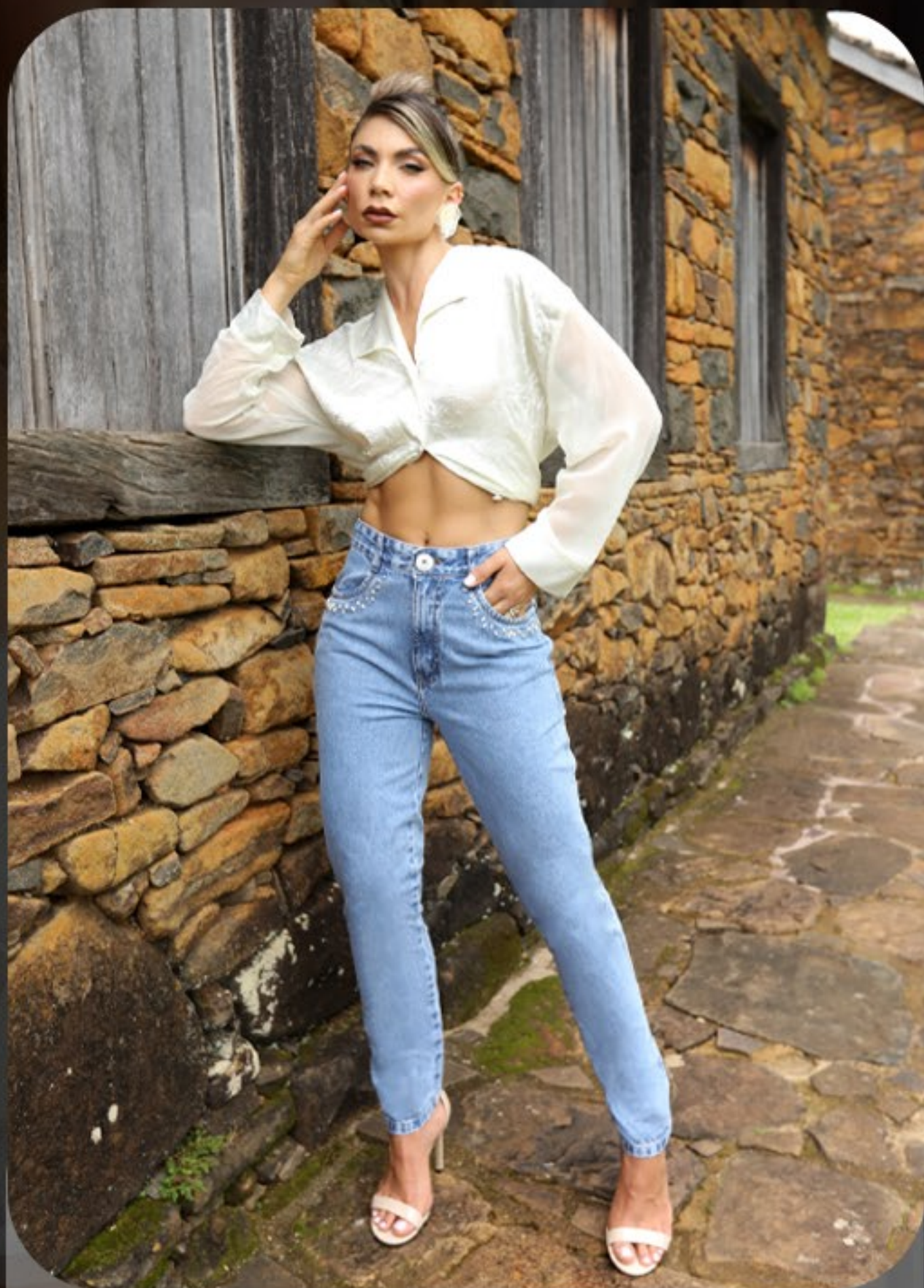
CF Cigarrete com detalhe smiril