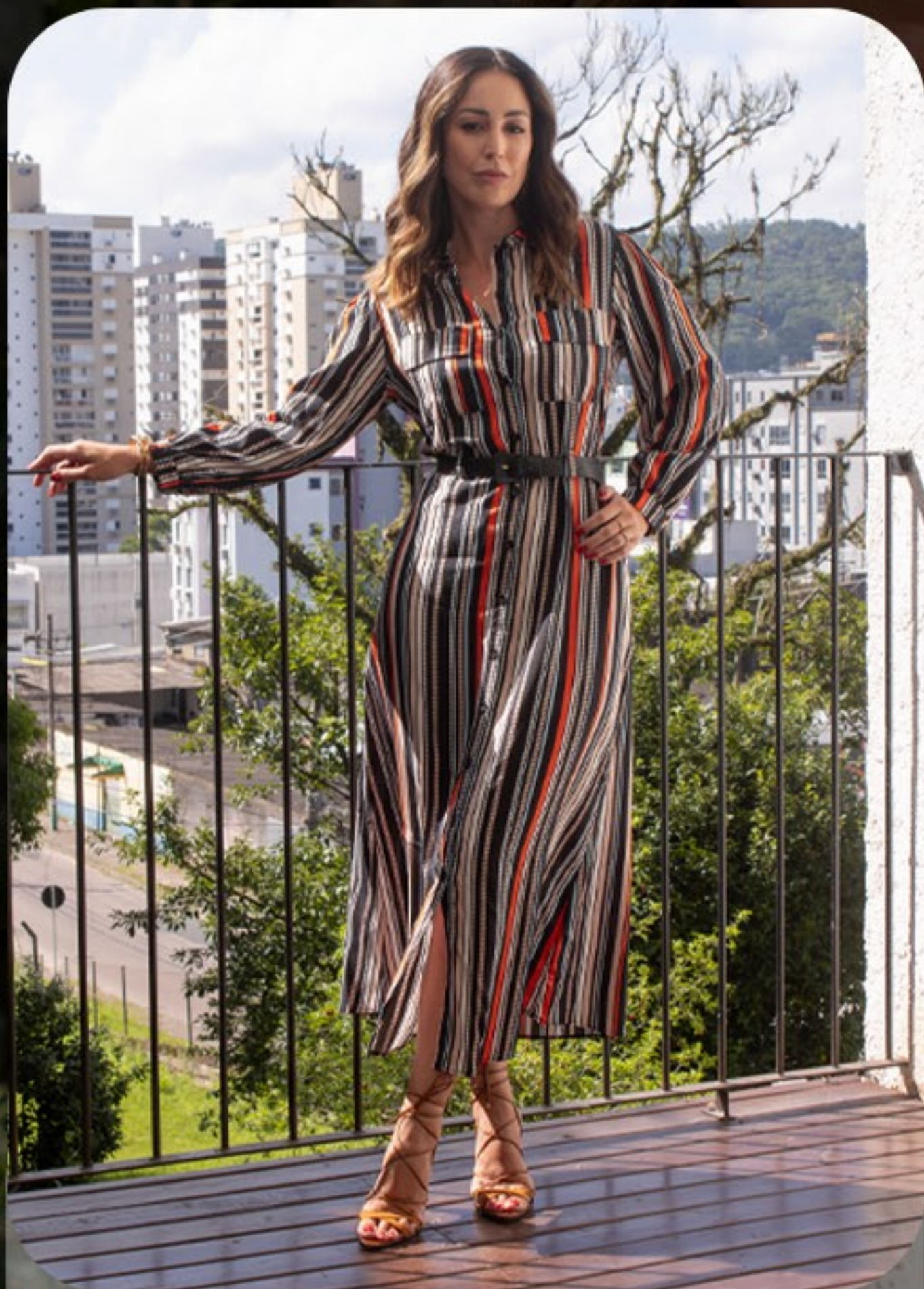
Vestido Chemise feito em viscose estampada, possui faixa para amarração na cintura