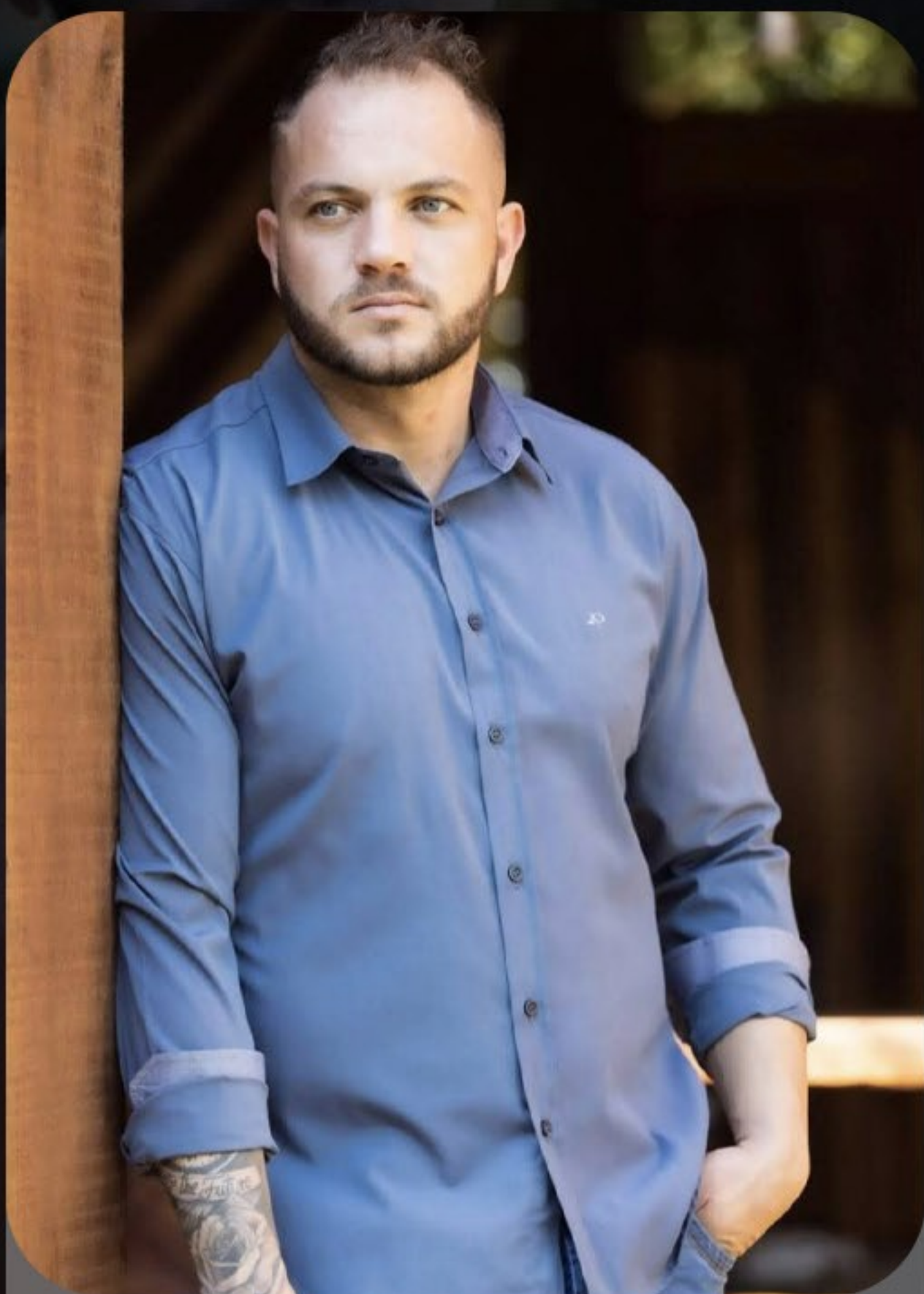
Camisa slim com elastano