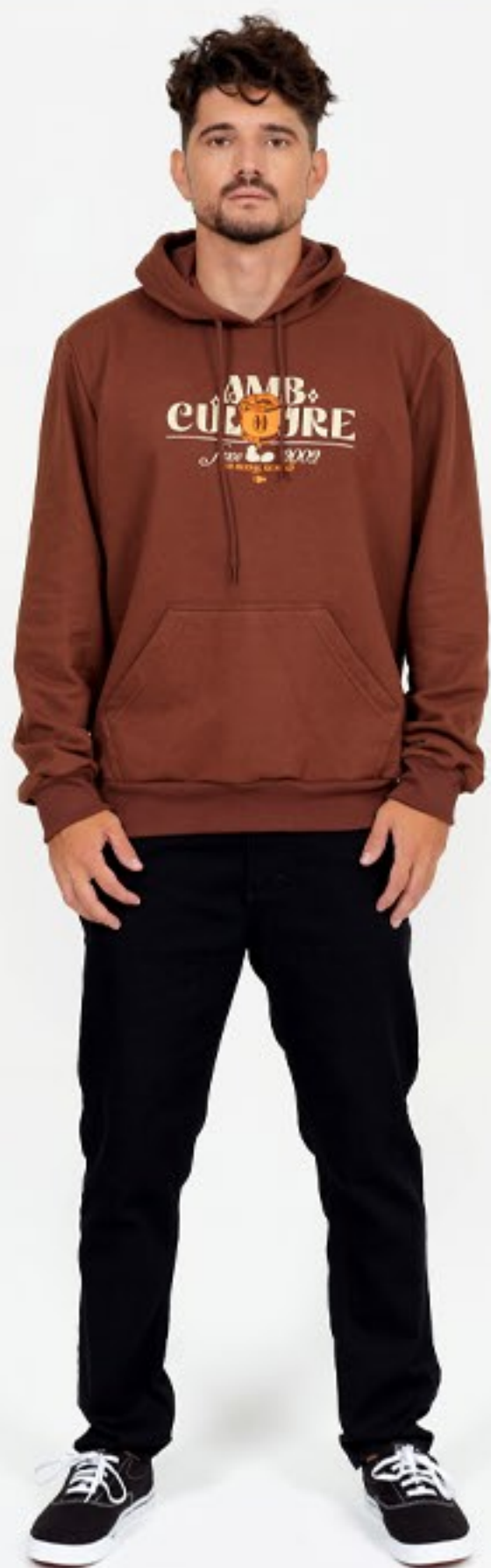
Blusão Canguru Fechado e calça, modelagem tradicional com bolsos frontais e traseiros