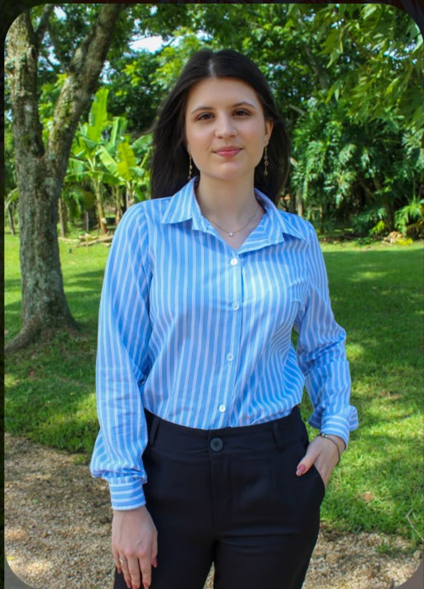
Camisa tricoline listrada