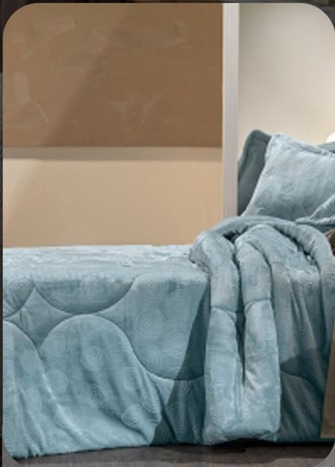
Edredom plush altenburg