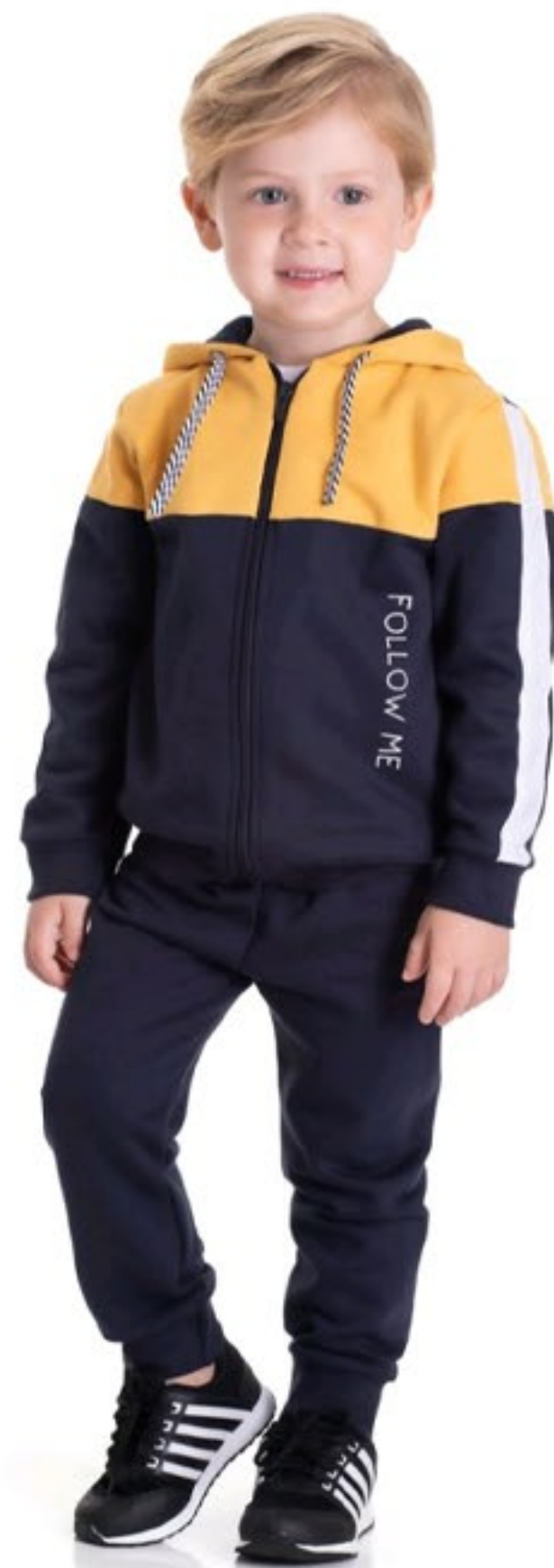
Look menino conj Jaqueta e calça Jogger moletom. Tam 01 ao 03