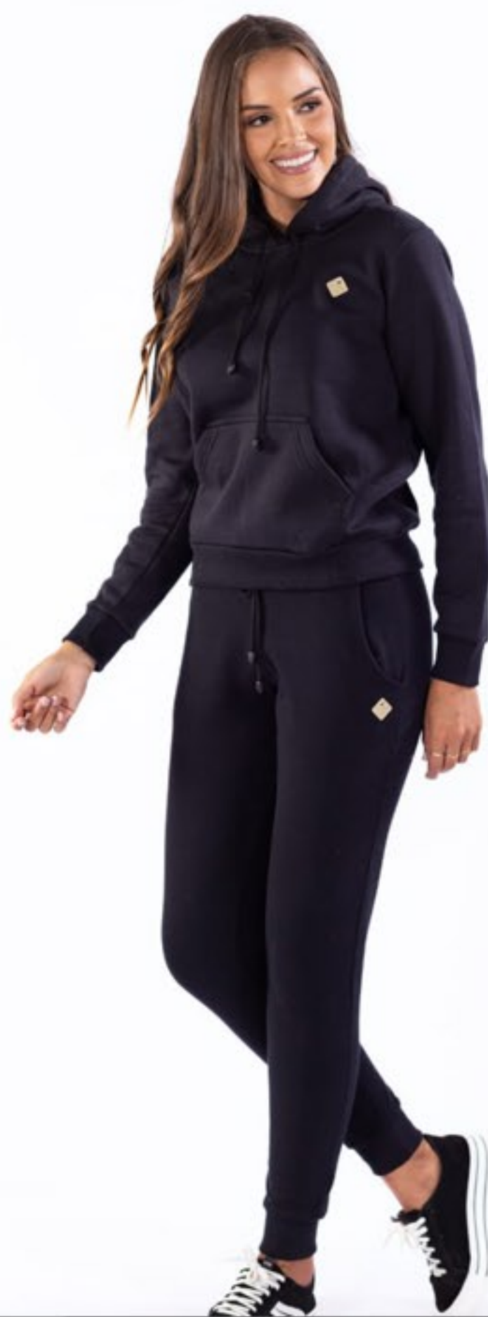
canguru feminino e calça de moleton fem