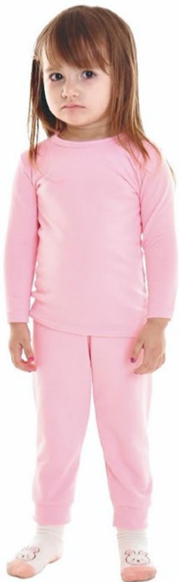
Conjunto térmico cores variadas. Tam P ao I2