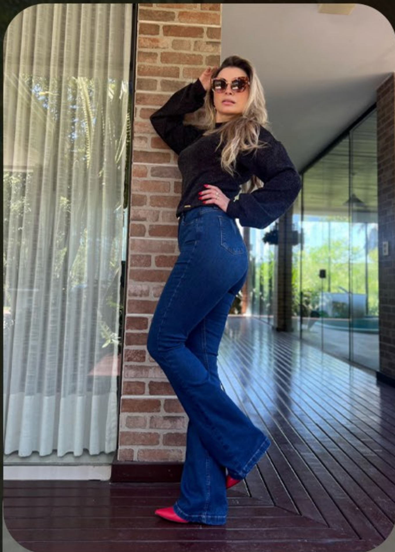
Calça flare MODELADORA Kizari blusa com manga fofa em malha lã