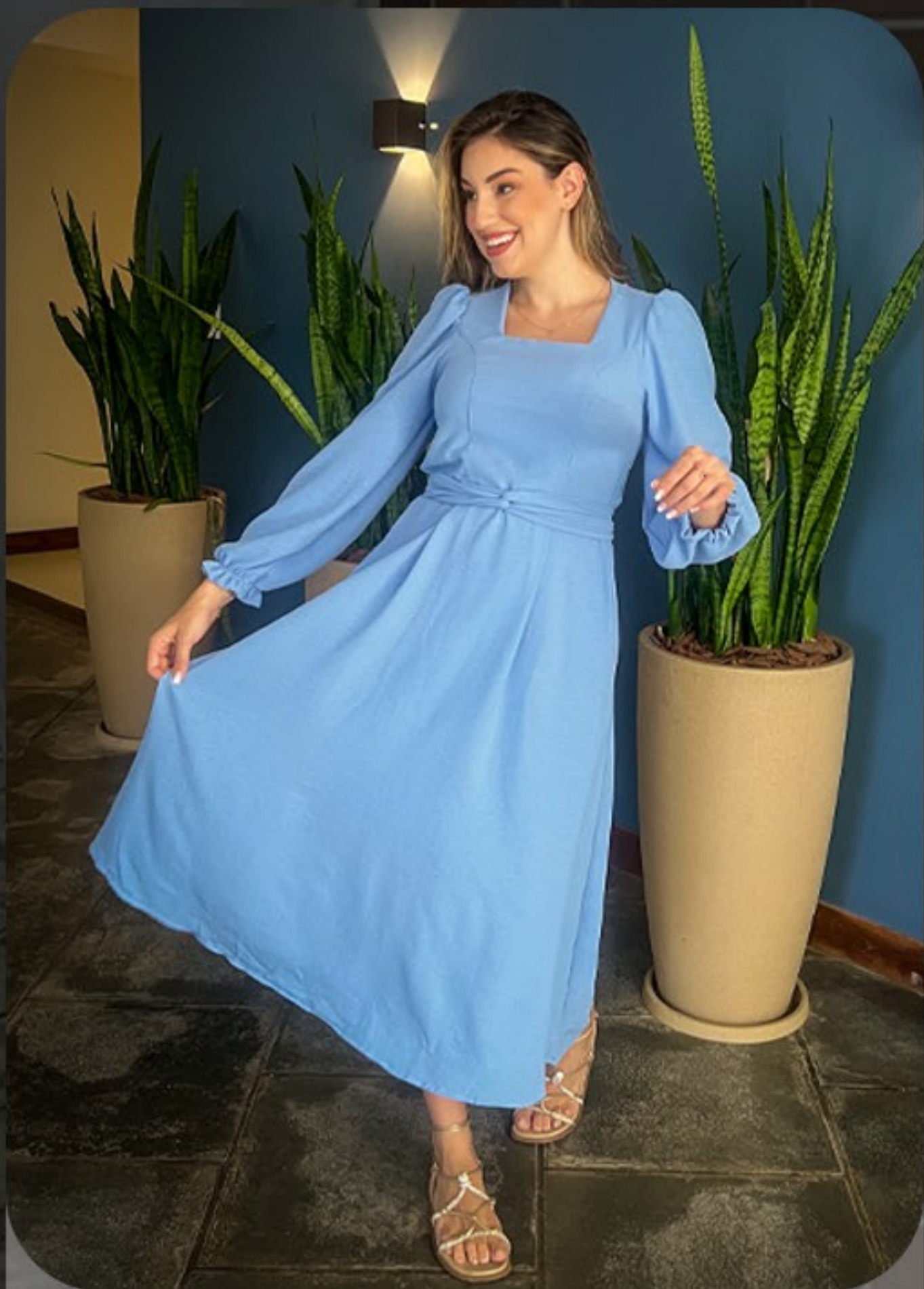
Vestido degote quadrado Azul e azul céu, do P ao XGG