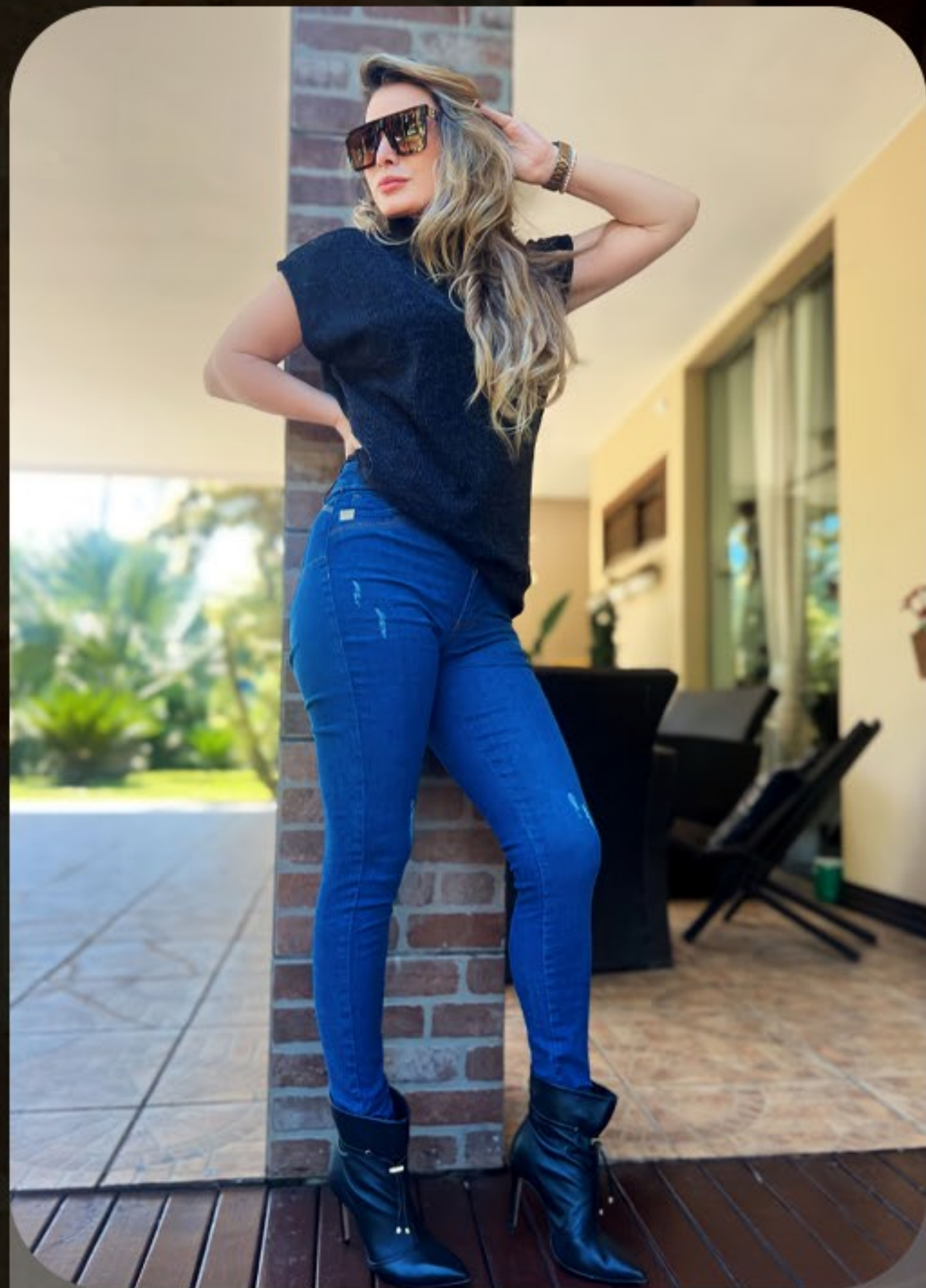
Calça skiny levanta BUMBUM Kizari colete amplo em malhalã