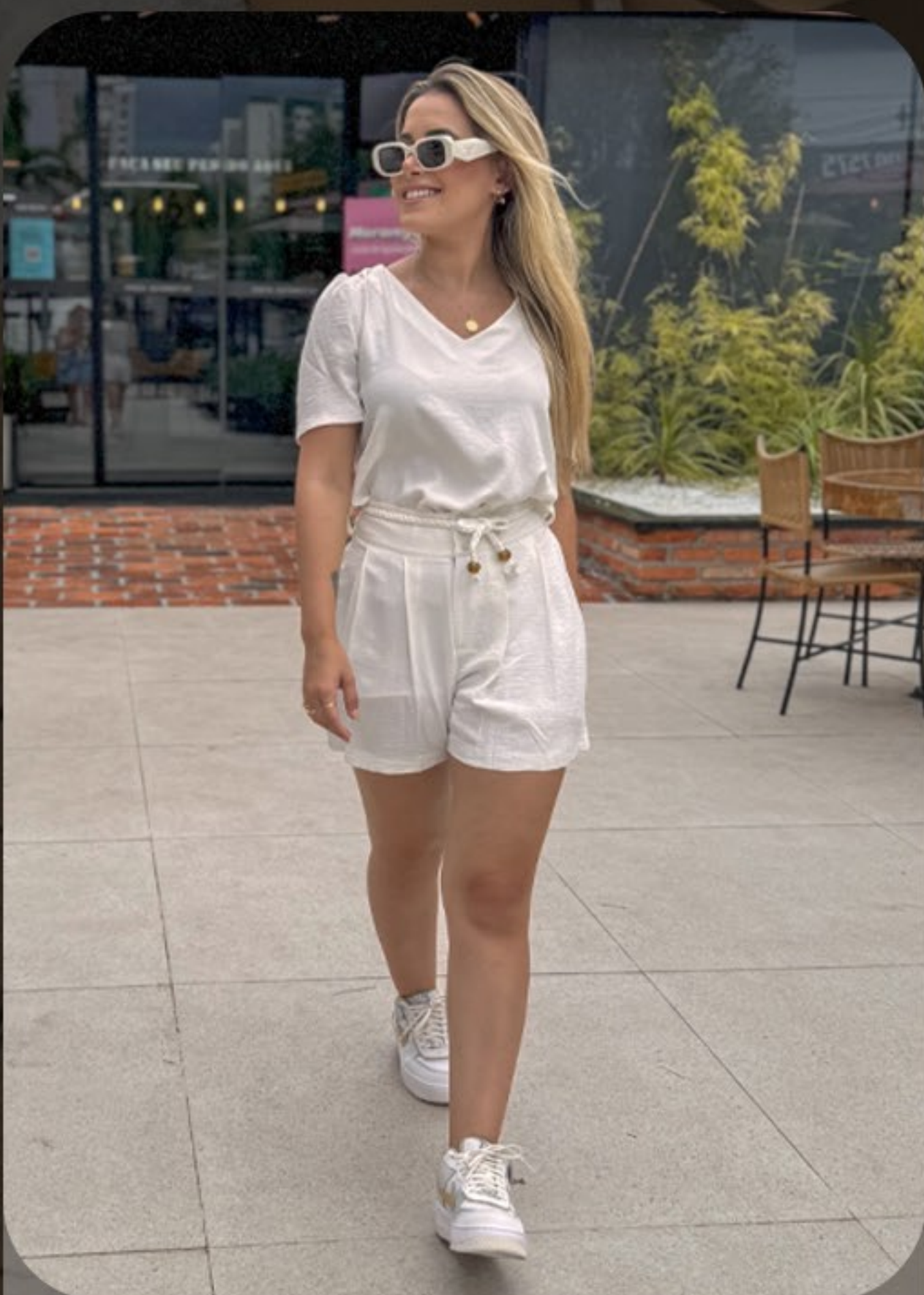
Blusa em tecido air flow. Shorts em tecido air flow forrado, com cinto