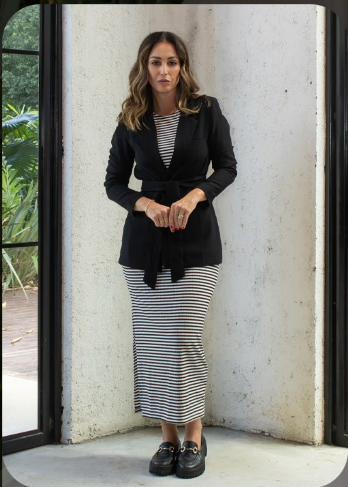
Vestido canelado listrado + blazer alongado em alfaiataria com faixa para amarração