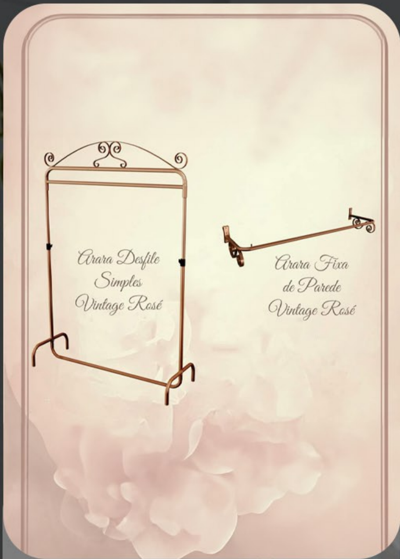
Arara vintage rosé de chão e parede