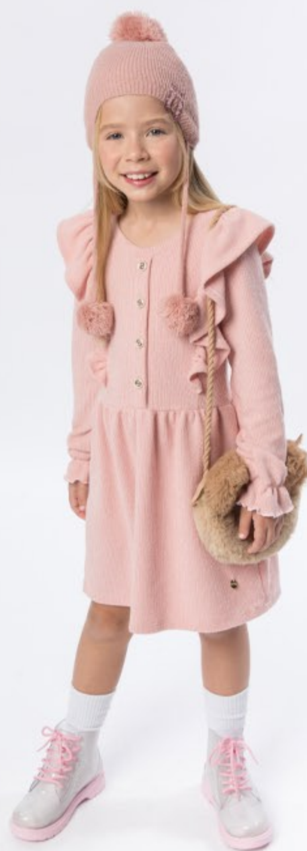
Vestido cotelê. Tam 4 ao 14