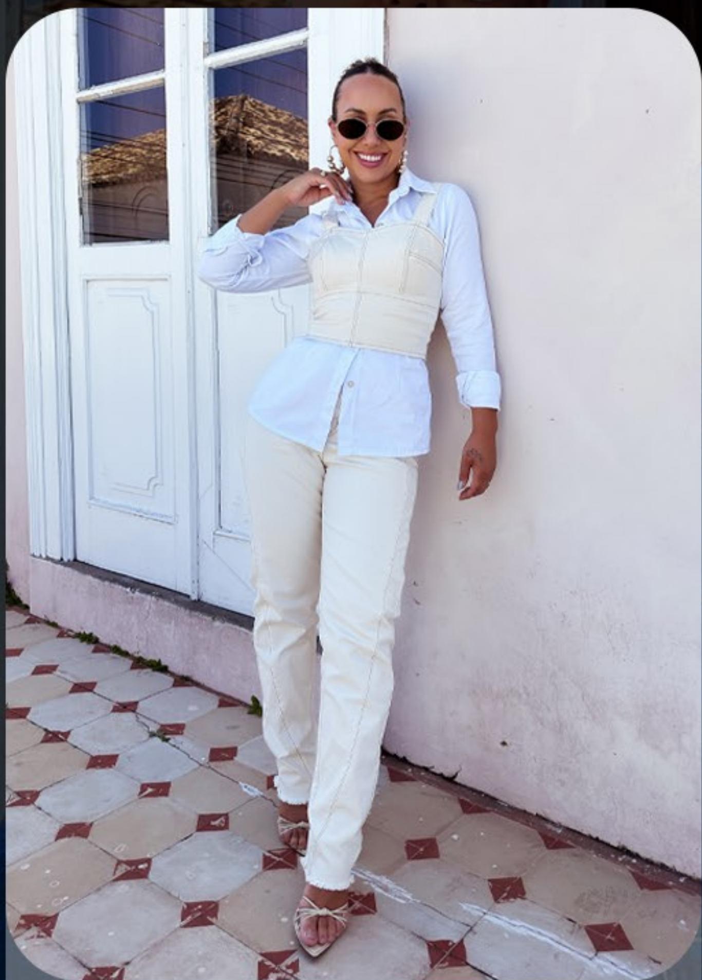
Top off , camisa e calça mom