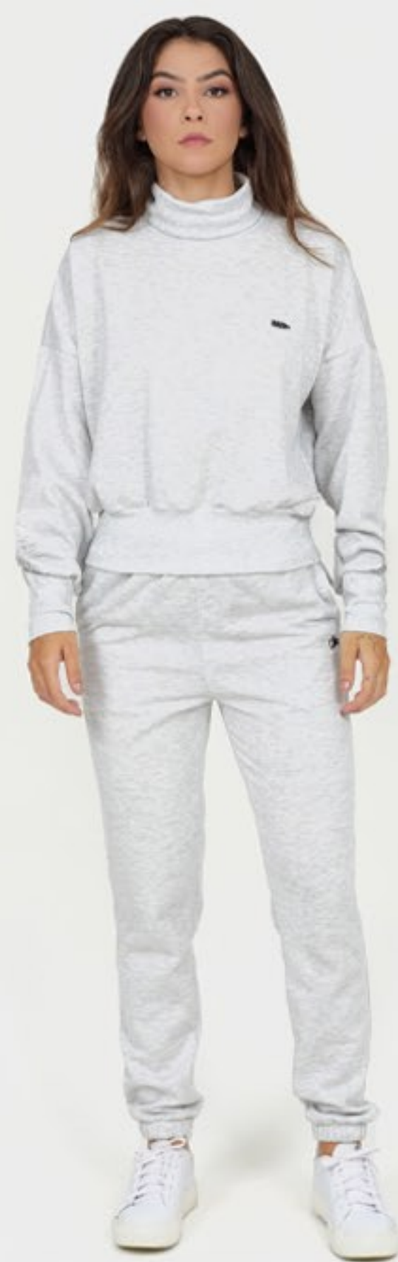
Moletom liso com gola alta e calça de modelagem tradicional