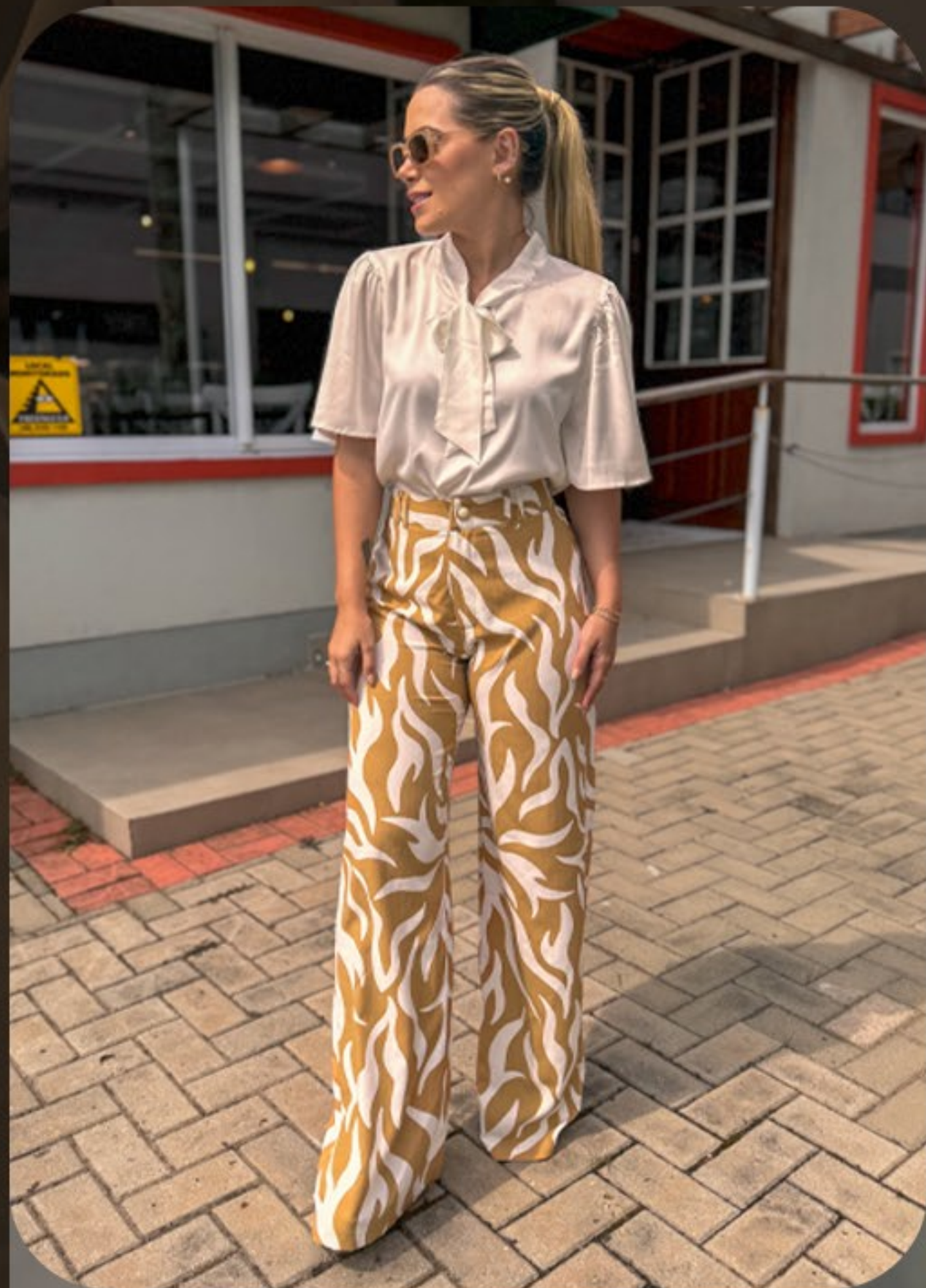
Blusa de acetinada. Calça pantalonada em tecido estampada, com cós alto