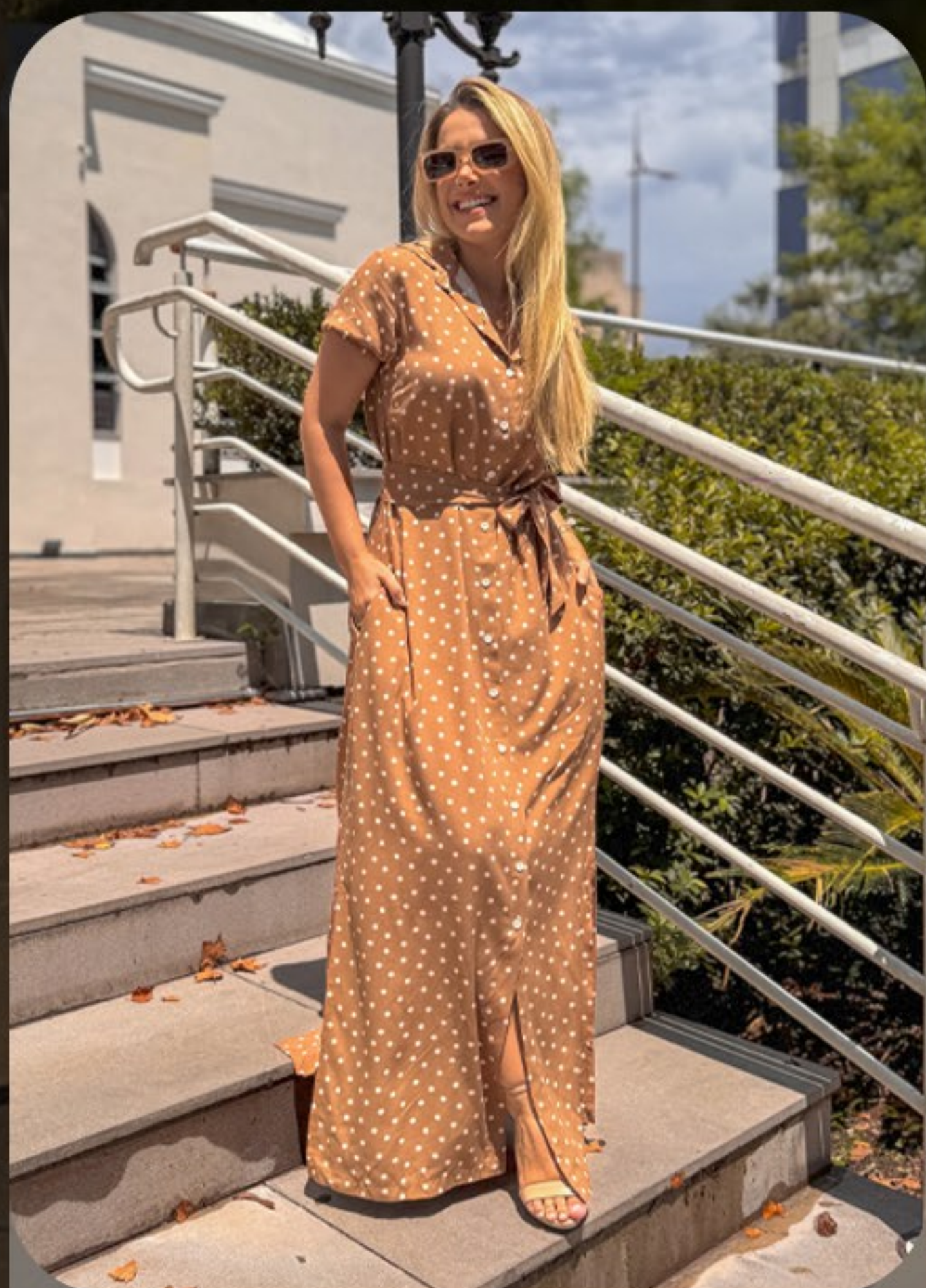
Vestido modelo chemise longo em tecido viscose com gola tradicional, com cinto