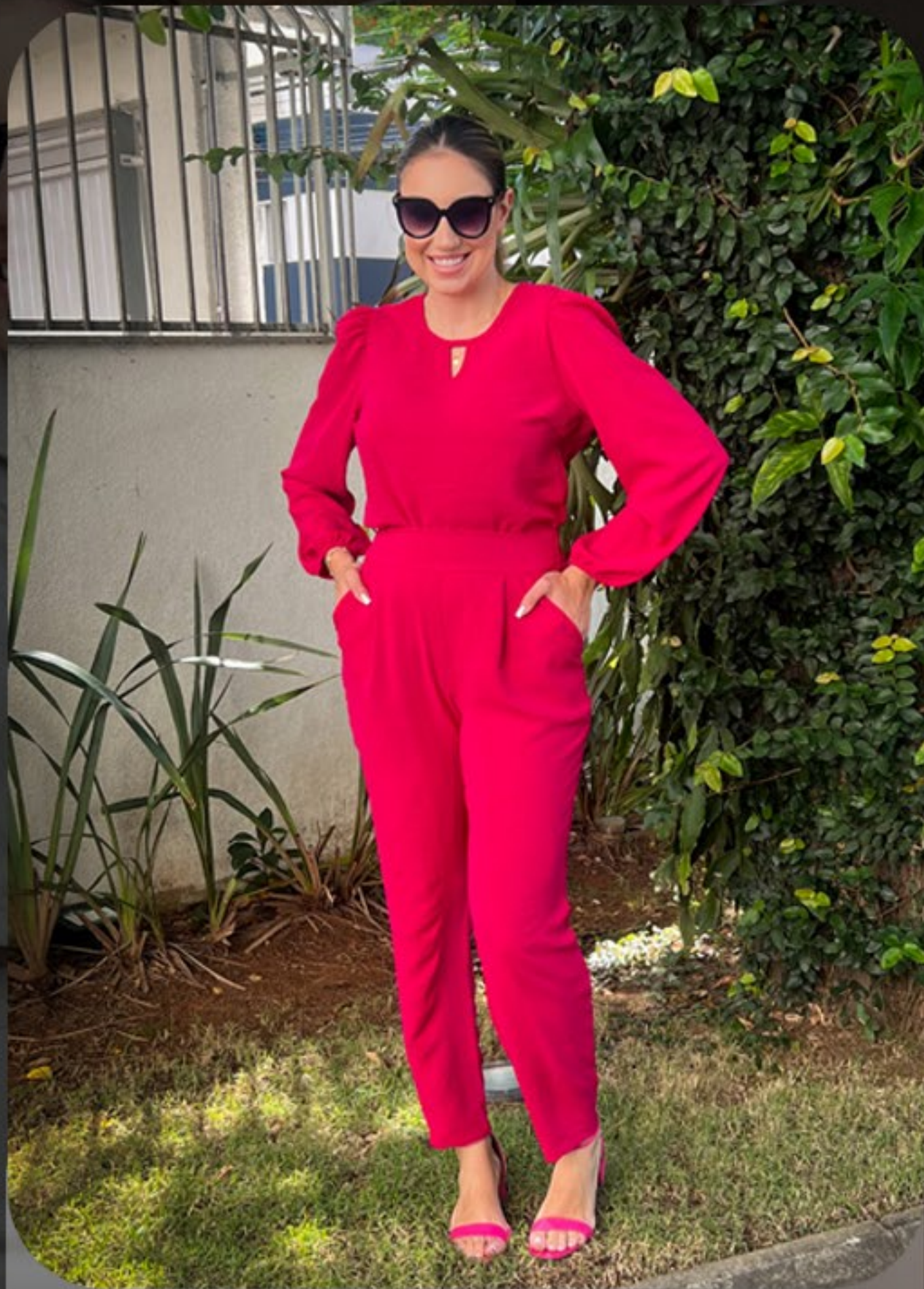
Blusa de gota e calça cenoura preta e cereja, do P ao XGG